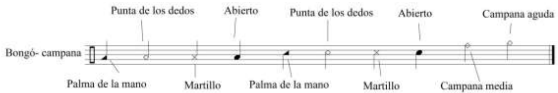
Figura 7. Notación claves