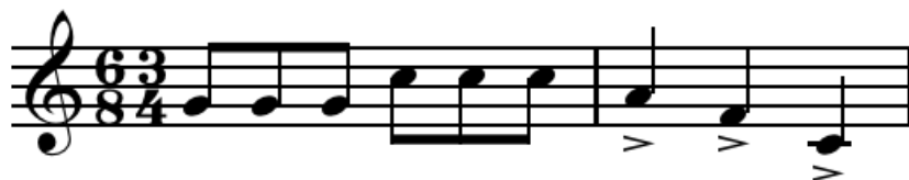
Figura 24. Hemiola horizontal

2.4.2.2 Cliché cromático. En general se denomina cliché a la armonización realizada sobre una línea cromática. Los clichés más típicos se producen en el modo menor y sobre una línea descendente que une el I grado con el V, siendo armonizada con acordes diatónicos. En los clichés, la línea cromática acostumbra a situarse en el bajo, aunque también puede estar en alguna voz interior e incluso en la melodía.