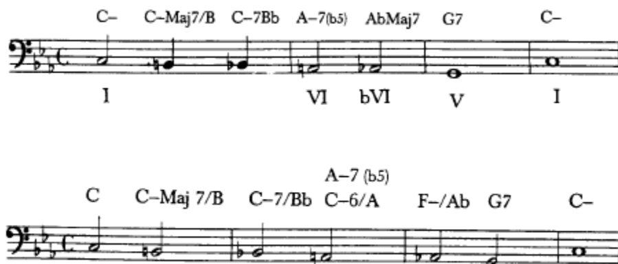
Figura 25. Cliché cromático

“La armonización de estos clichés empieza normalmente con el acorde I y este, seguido de inversiones sobre sí mismo. Aparecen algunos acordes de subdominante para finalmente llegar al dominante”. 19