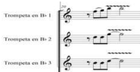
Figura 72. Arturo chiva trompetas

PARTE B En esta parte tenemos la melodía principal en las trompetas que están armonizadas en bloque, el trombón 1 lleva contrapuntos mientras que el trombón 2 tiene colchón armónico. Los saxos llevan Background y contrapuntos. La percusión pasa de porro cerrado a porro abierto.