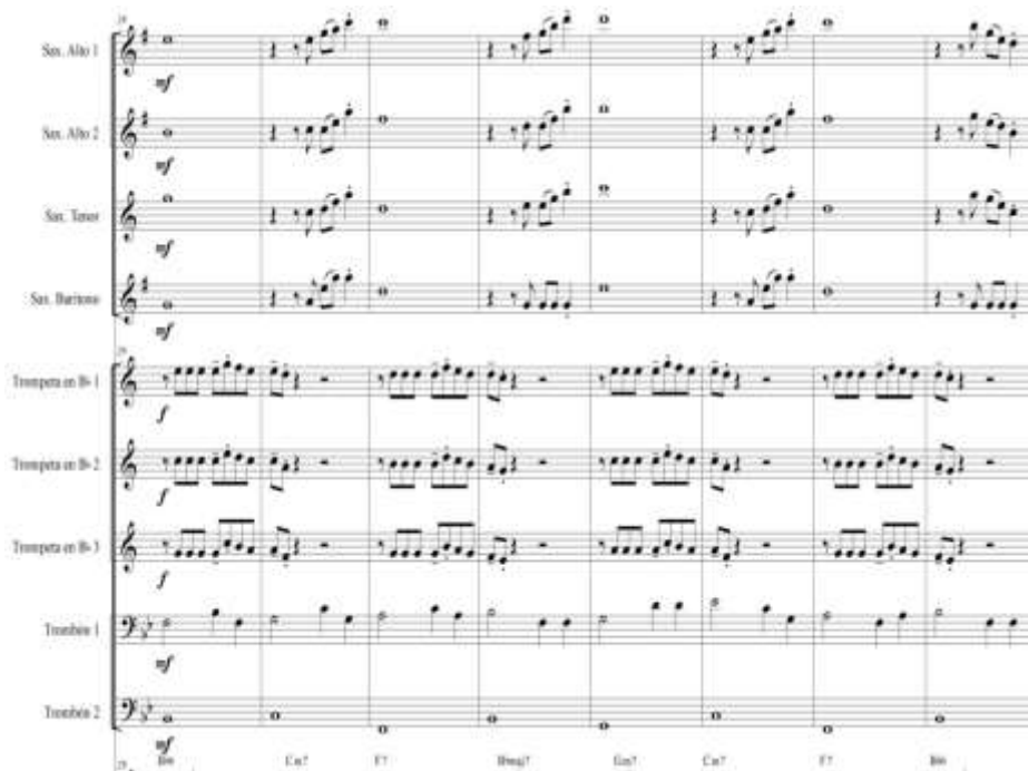
Figura 73. Arturo parte B

PARTE B En esta parte tenemos la melodía principal en las trompetas que están armonizadas en bloque, el trombón 1 lleva contrapuntos mientras que el trombón 2 tiene colchón armónico. Los saxos llevan Background y contrapuntos. La percusión pasa de porro cerrado a porro abierto.