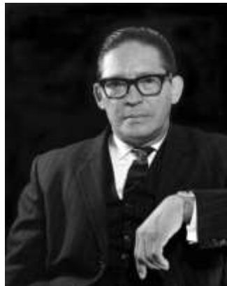
Figura 67. Lucho Bermúdez

Luis Eduardo Bermúdez Acosta nació el 25 de enero de 1912 en Carmen de Bolívar y murió el 23 de abril de 1994 en Bogotá. Más conocido como Lucho Bermúdez, fue un músico, compositor, arreglista, director e intérprete colombiano. El maestro Lucho Bermúdez es considerado uno de los más importantes intérpretes y compositores de música popular colombiana del siglo XX. Fue el