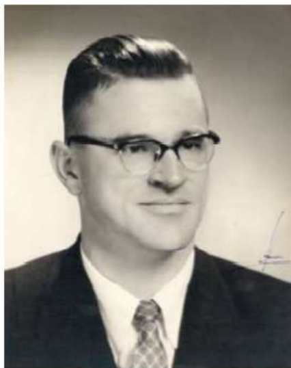
Figura 27. Gustavo Gómez Ardila

Gustavo Gómez Ardila fue compositor y director de coro, y es considerado uno de los maestros colombianos que dio mayor renombre al canto coral del país. Nació el 8 de septiembre de 1913 en Zapatoca, Santander y murió el 23 de mayo de 2006 en Bucaramanga.