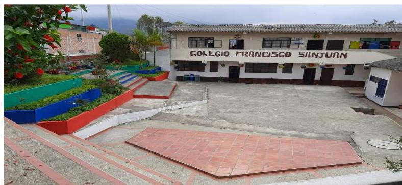
Panorámica del Colegio Francisco San Juan

Nota. Foto Suministrada por la Rectoría del Colegio septiembre de 2024