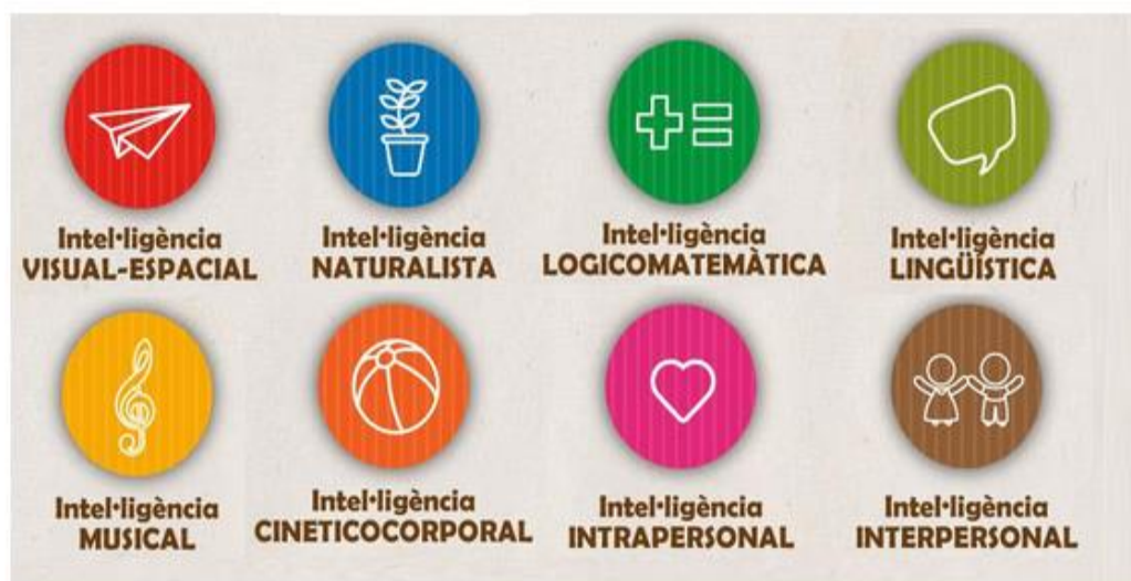
Gráfico de las Inteligencias Múltiples de Gardner

Nota: este grafico muestra las inteligencias múltiples.