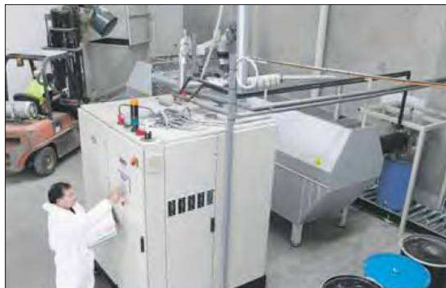
Figura 4. MRT Continuo.