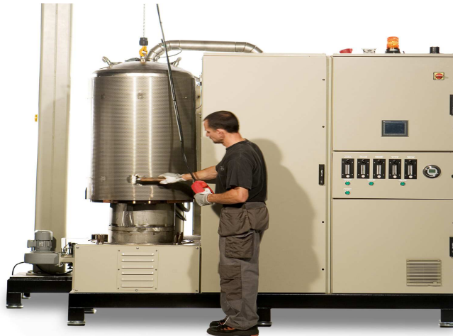
Figura 5. Batch Distiller Continuous Flow Distiller.