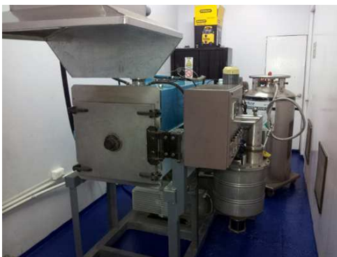
Figura 2. Maquinaria utilizada para recuperar el mercurio

Manejo de subproductos del proceso de desmercurización: El producto principal resultante es el mercurio recuperado, el cual resultara en cantidades muy pequeñas (p.ej. cantidad de lámparas fluorescentes tratadas diariamente con el funcionamiento durante 24 horas es de 2.200 unidades, cada una con el contenido aproximado de 6 mg de mercurio, resultando recuperación diaria de mercurio de 132 gramos), estimando la producción mensual de 3,7 kg y anual de aproximadamente 45 kilos. El mercurio es acumulado y almacenado en recipientes especiales y anualmente es comercializado. Los demás residuos como vidrio, casquillo de Al y polvo fluorescente (silicato) son separados por zarandeo y aprovechados (casquillo como materia prima de la fundición, vidrio y polvo fluorescente para materiales de construcción), en algunos casos cuando hay sobreoferta de materiales requerirán disposición final en relleno sanitario ya que no contienen sustancias peligrosas. No se generaran pasivos ambientales por la disposición final.