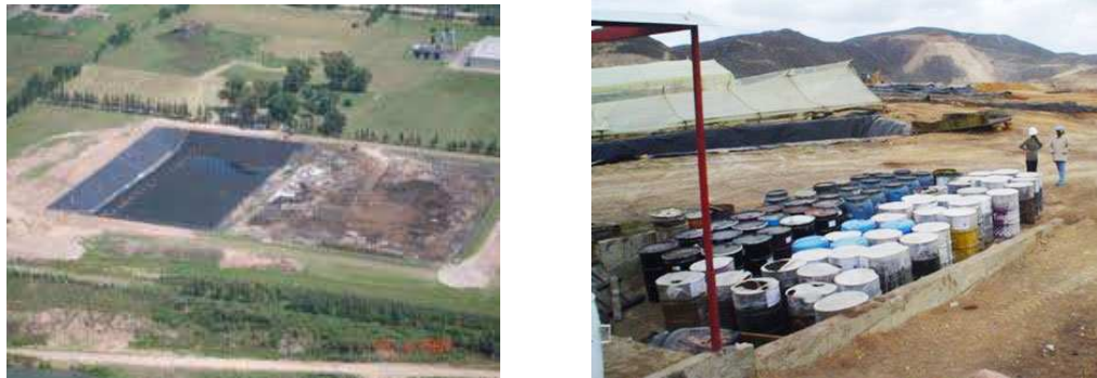
Figura 3. Relleno de seguridad