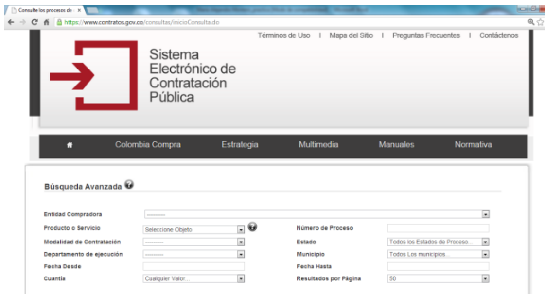
Figura 2: Sistema Electrónico de Contratación Pública