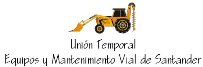
Figura 10: Logo Unión Temporal Equipos y Mantenimiento Vial de Santander