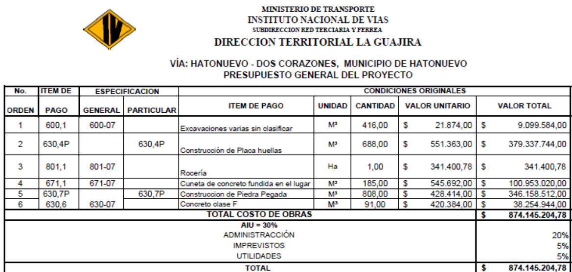
Figura 5: Ejemplo Presupuesto Oficial para un proyecto del Instituto Nacional de Vías.