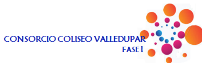
Figura 8: Logo Consorcio Coliseo Valledupar Fase I