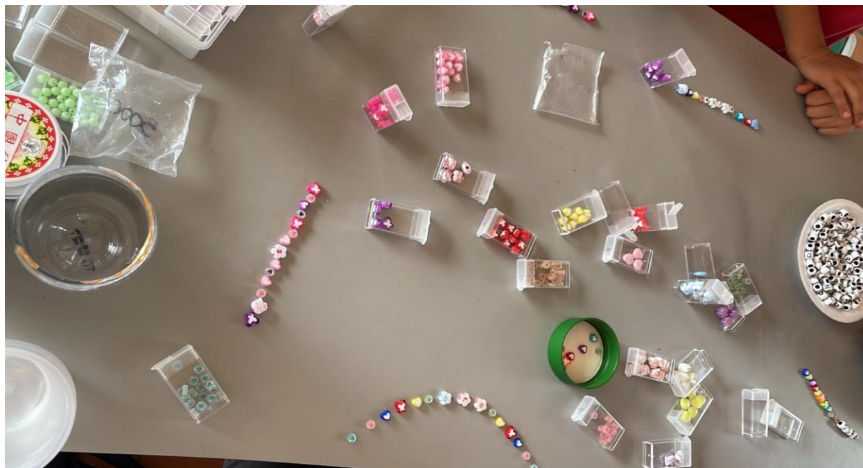
Apéndice N. Fotografía creación de manilla.