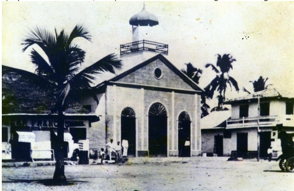
Cortesía: MONCADA RODRIGUEZ, Arturo. Capilla San Luis Beltran. 1924.