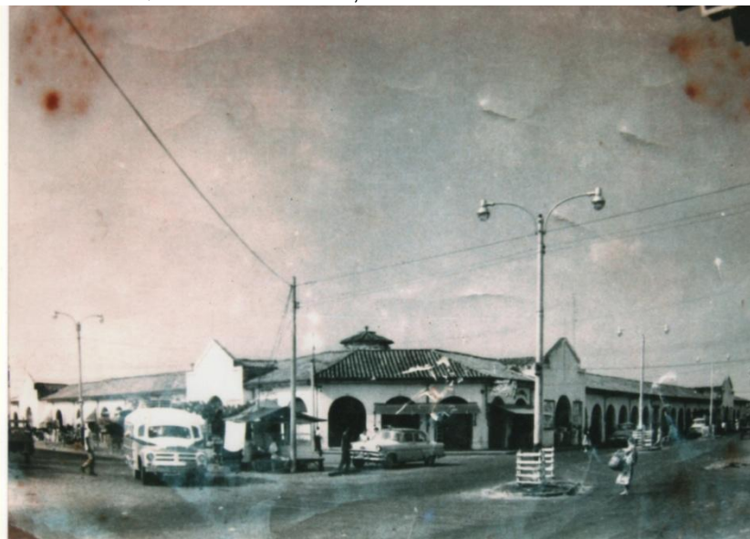
Cortesía: VELASQUEZ RODRIGUEZ, Rafael Antonio. Plaza de Mercado. 1960.