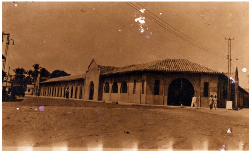
Cortesía: VELASQUEZ RODRIGUEZ, Rafael Antonio. Plaza de Mercado. 1948.