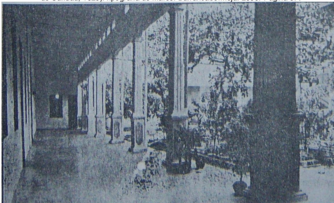
REGISTRO MUNICIPAL. Edición Extraordinaria No 57. (Hospital de Caridad). Barrancabermeja. Septiembre de 1939.