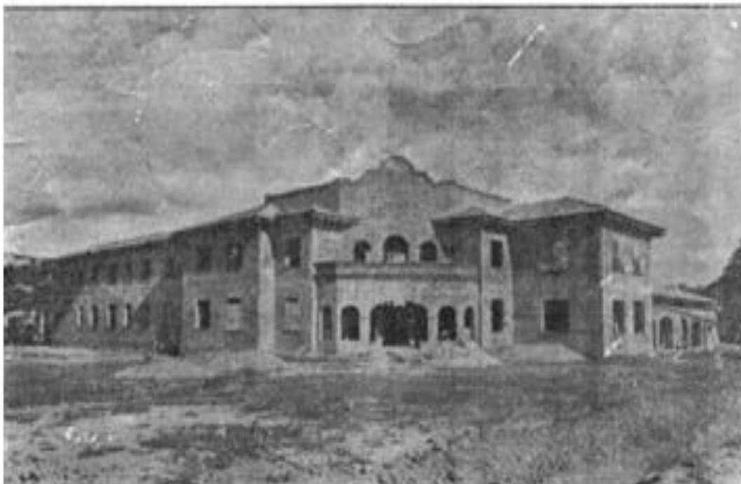
REVISTA PIPATÓN Nº 6. (Hotel Pipatón). Barrancabermeja. Febrero de 1942.