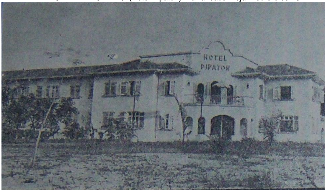
VALBUENA, Martiniano. Memorias de Barrancabermeja, Vol. XVI. Biblioteca Santander. Bucaramanga. 1947. Página 264.