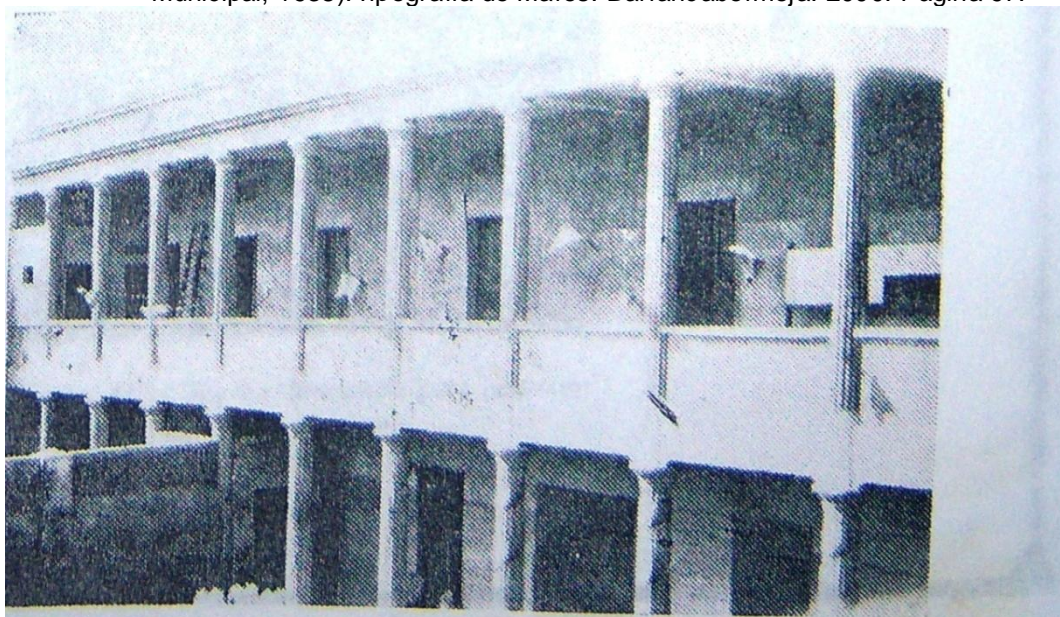
REGISTRO MUNICIPAL. Edición Extraordinaria No 57. (Palacio Municipal). Barrancabermeja. Septiembre de 1939.