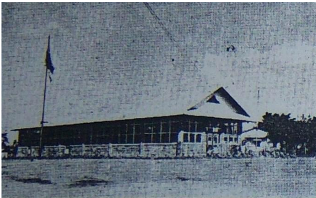
REVISTA PIPATÓN Nº 5. (Centro Juvenil). Barrancabermeja. Agosto de 1941. Página 20.