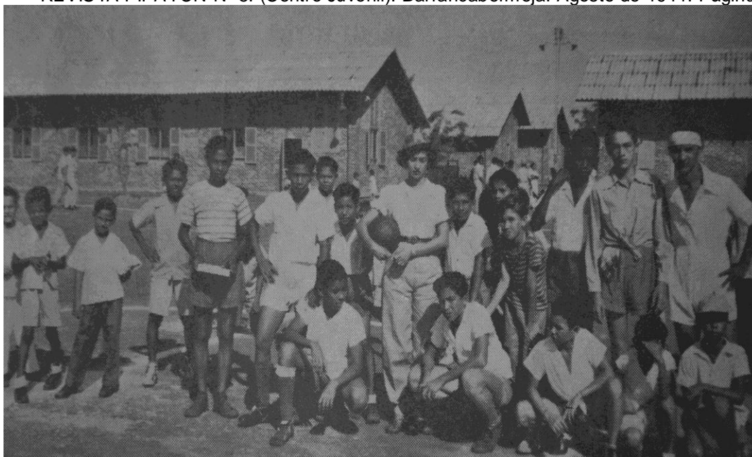
Cortesía: MONCADA RODRIGUEZ, Arturo. Equipo Centro Juvenil. 1953.