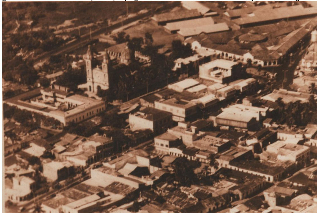
Cortesía: MONCADA RODRIGUEZ, Arturo. Iglesia Sagrado Corazón de Jesús y Campamentos de la Tropical Oil Company. 1965.