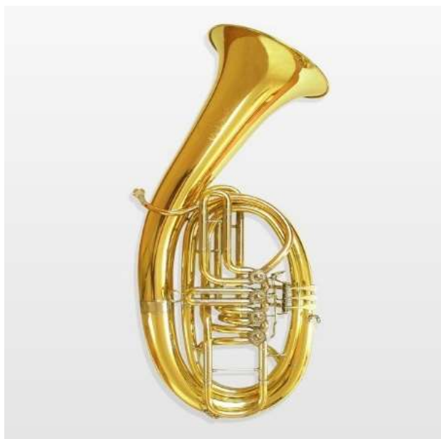
Figura 16. Ejemplo 2 “Tuba Wagneriana”