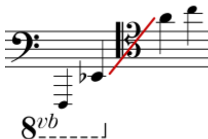
Figura 18. Ejemplo 4 “Registro de la Tuba”.

Su registro va desde un Re1 hasta un fa4