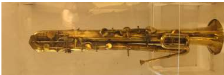
Figura 15. Ejemplo 1 “Ofliceido”.