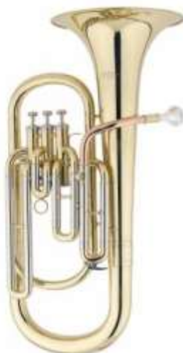
Figura 19. Ejemplo 1 “Barítono”.

Pertenece a las familias de las tubas, recibe otros nombres como Eufonio o Bombardino, las diferencias son que unos leen en clave de sol y otros en fa, pero su sonoridad es la misma, tiene el mismo registro. El barítono lee en clave de sol y es un instrumento transpositor muy versátil y de gran agilidad.