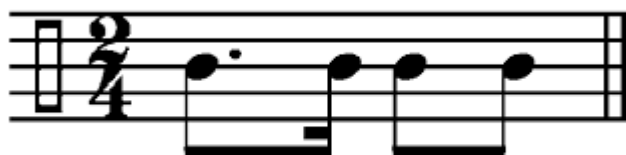
Figura 2. Ejemplo 2 habaneras “Base rítmica de la Habanera”.

Este género puede ser adaptado en diferentes grupos musicales pero lo más habitual es que sea cantada.