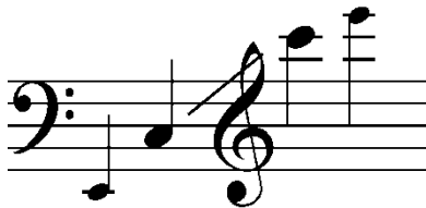
Figura 11. Ejemplo 2. “Registro del Trombón Tenor”. Recuperad de: http://cpmsabinanigo.catedu.es/evolucion-historica-del-trombon-de-varas/

Su registro va desde mi 2 hasta un Sib 4 , esto varía según el instrumentista.