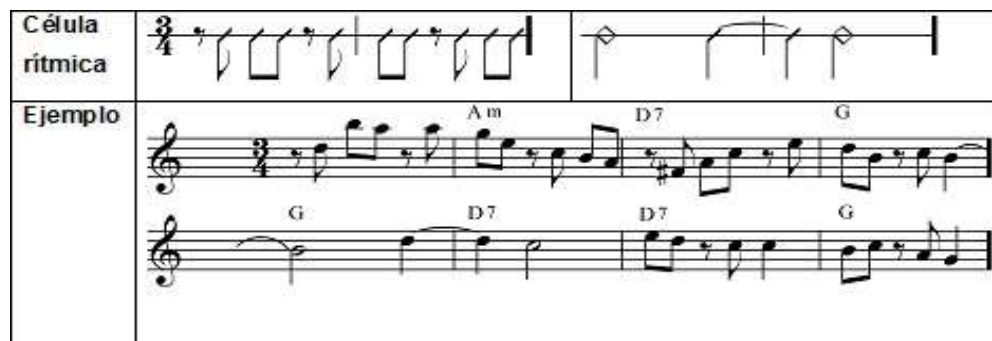
Figura 3. Ejemplo 3 “Base rítmica del Bambuco”. Recuperado de: http://www.musigrafia.org/acontratiempo/?ediciones/revista-15/articulos/improvisacin-en-el-pasillo-y-el-bambuco-de-la-regin-andina-colombiana.html

Sus grandes exponentes son: el tolimense Cantalacio Rojas, el huilense Jorge Villamil y el antioqueño Pelón Santamarta.