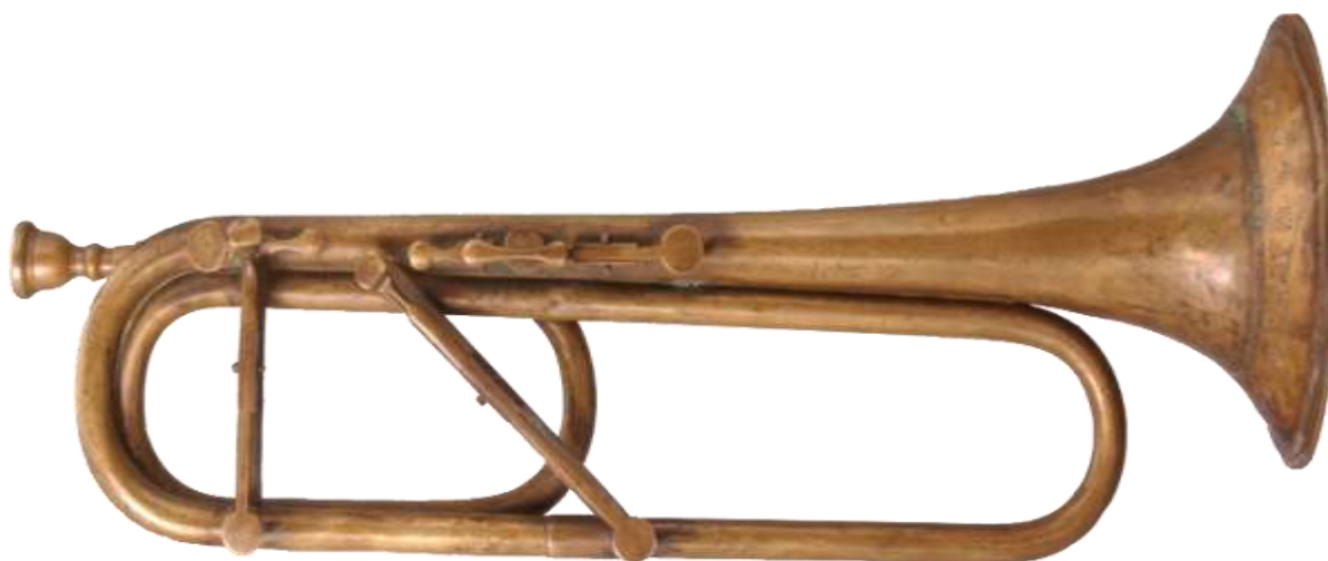
Figura 6. Ejemplo 2 “Primera trompeta con mecanismo cromático”.