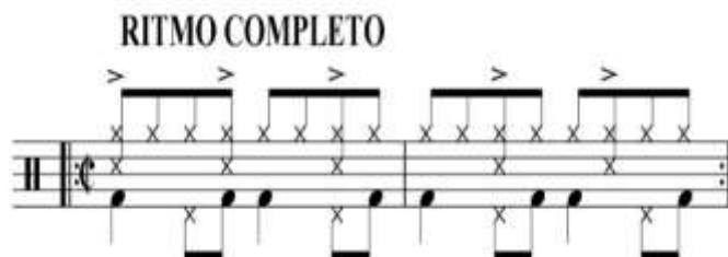
Figura 4. Ejemplo 4 “Base rítmica del Bossa Nova”.