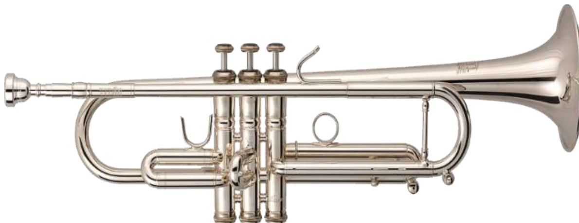
Figura 8. Ejemplo 4 “Trompeta de pistones”.

Hoy en día existen muchos tipos de trompetas en todas las tonalidades en sib, mib, do, re, piccolos, fliscornos o bugles, entre otros. Su registro va desde el Fa# en la escala pequeña del piano hasta el do 3 y esto puede variar según el instrumentista.