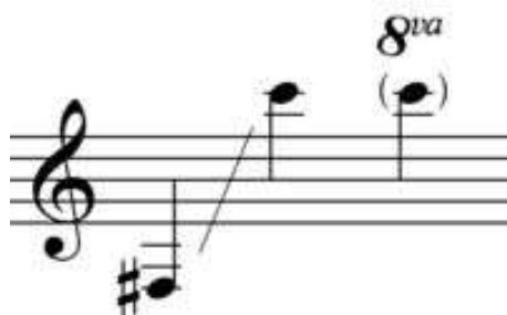
Figura 9. Ejemplo 5 “Registro de la Trompeta”.

Hoy en día existen muchos tipos de trompetas en todas las tonalidades en sib, mib, do, re, piccolos, fliscornos o bugles, entre otros. Su registro va desde el Fa# en la escala pequeña del piano hasta el do 3 y esto puede variar según el instrumentista.