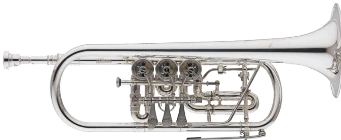
Figuras 7. Ejemplo 3 “Trompeta de rotores o Alemana”.

En el siglo XIX se desarrolla la trompeta moderna, la que conocemos hoy en día, existen dos mecanismos, de pistones y de válvulas, están hacen que el instrumento pueda hacer cromatismo.