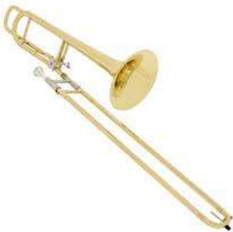
Figura 10. Ejemplo 1 “Trombón Tenor”.

Su registro va desde mi 2 hasta un Sib 4 , esto varía según el instrumentista.