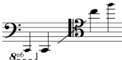
Figura 13. Ejemplo 4 “Registro del Trombón Bajo”

Fuente http://cpmsabinanigo.catedu.es/evolucion-historica-del-trombon-de-varas/