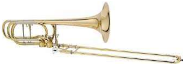
Figura 12. Ejemplo 3 “Trombón Bajo”.

Es el tercero de la familia de trombones, es el más grande de todos los trombones, su cuerpo y pabellón son grandes y la boquilla es más grande, a diferencia del tenor o el alto.