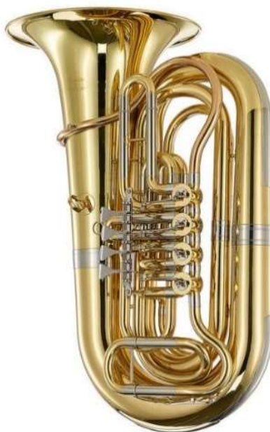
Figura 17. Ejemplo 3 “Tuba moderna en Sib”.

Su registro va desde un Re1 hasta un fa4