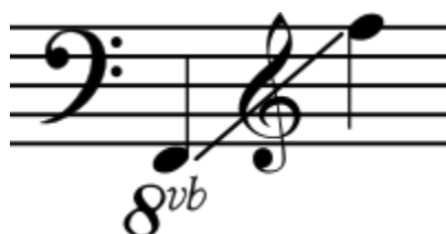
Figura 20. Ejemplo 2 “Registro del Barítono”.

Su registro va desde un mi 2 hasta un sib 4, son similares al registro del trombón tenor.