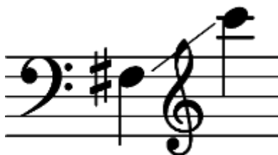
Figura 14. Ejemplo 5 “Registro del Trombón alto”.

“se usó mucho en el siglo XIX y más por compositores alemanes e italianos” Samuel Adler, Estudio de la orquestación. En el siglo XVIII se usó como solista. De la familia de trombones es el más agudo. Está afinado en Mib y se escribe con clave de Do en tercera línea. Su registro va desde un la 2 hasta un Mib 4 .