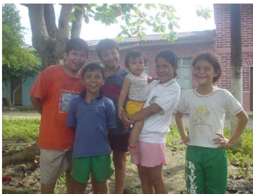
Gráfico 10. Taller 4. Nutrición y hábitos alimenticios – peso talla y desparasitación – Vereda Diamante – Sabana de Torres - Santander

Con la consecución de este objetivo el proyecto apunta al acceso de alimentos inocuos, y al aprovechamiento biológico, puesto que se desarrollan desde un enfoque agroecológico y la producción se da en los hogares de cada una de las