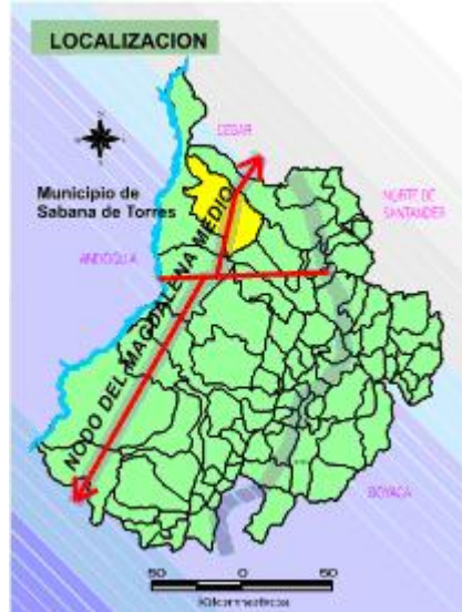
Grafico 3: Mapa Sabana de Torres