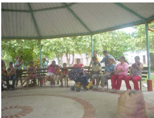
Gráfico 5. Jornada de Evaluación del Proyecto- Corregimiento Provincia- Sabana de Torres- Santander

En este semestre se desarrollaron 23 jornadas de identificación de necesidades e impacto de las mismas en la comunidad y 23 talleres de sensibilización que buscaban clarificar a las familias beneficiarios aspectos concernientes al desarrollo y los compromisos de las partes en la ejecución del proyecto, conocer las áreas disponibles de siembra de cada familia, ratificar por escrito el compromiso de cada familia, e Identificar las expectativas frente al proyecto de Seguridad Alimentaria por parte de las familias cogestoras.