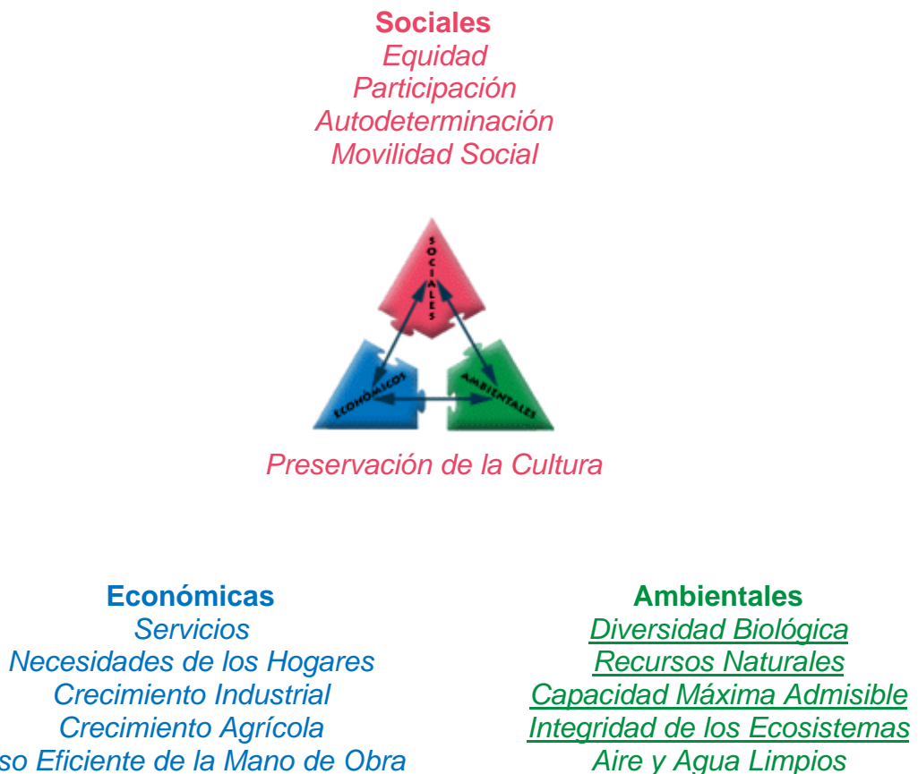
Grafico 1. Rompecabezas del Desarrollo Sostenible