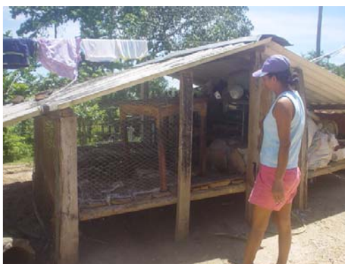
Gráfico 4. Caracterización familias cogestoras- Vereda Simonica- Rionegro (bajo) - Santander

Favorecer la organización comunitaria con el fin que actúe coordinadamente en pro de los objetivos comunes.