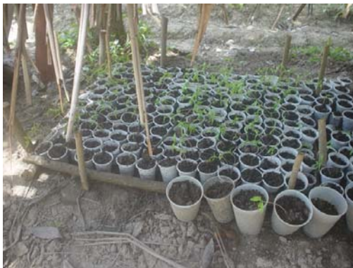
Gráfico 9. Taller 3 – Construcción y adecuación galpón – Vereda Robledo- Sabana de Torres - Santander