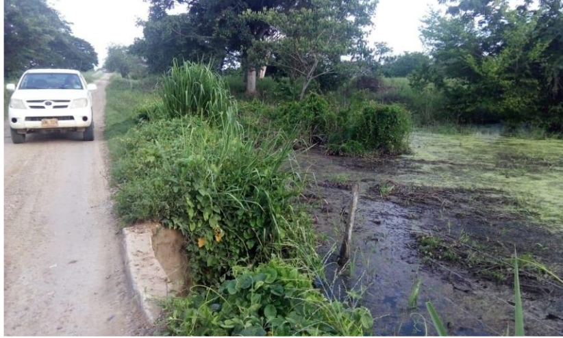
Fotografía 11 (PK) K13 + 700 vía Sabanas de San Ángel – Monterrubio

Hallazgos: Se encuentra box couvert de aproximados 3 mts con humedal y densa vegetación.