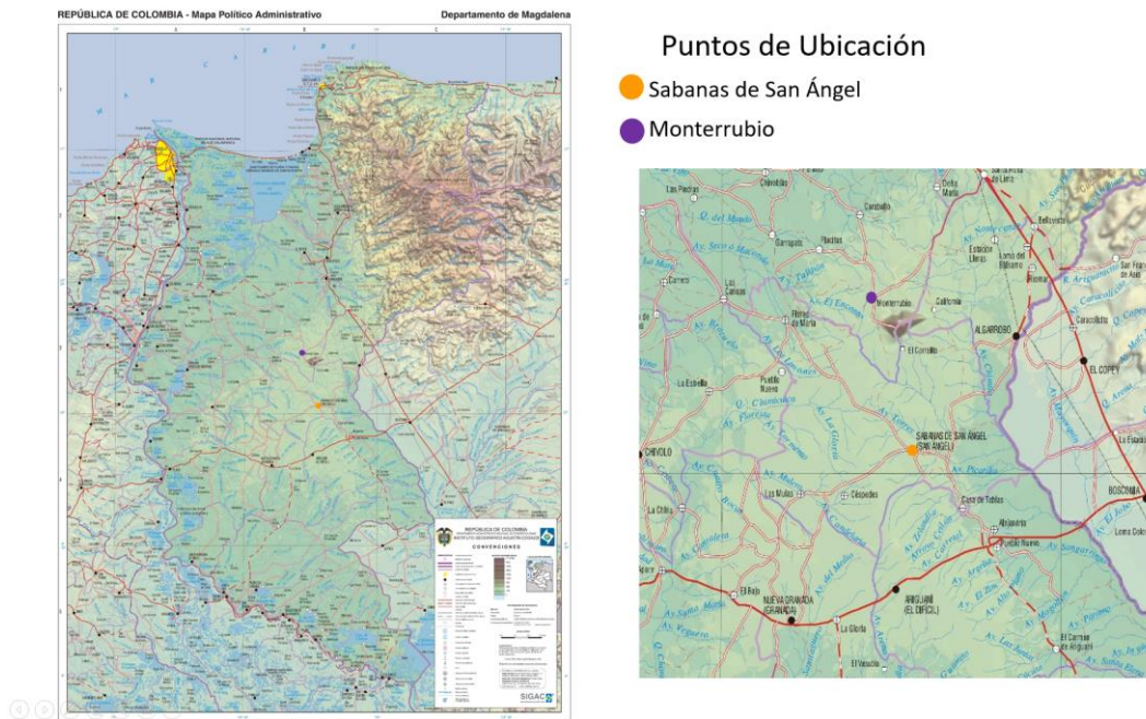
Imagen 1 Ubicación del proyecto en el Dpto. del Magdalena 6 .