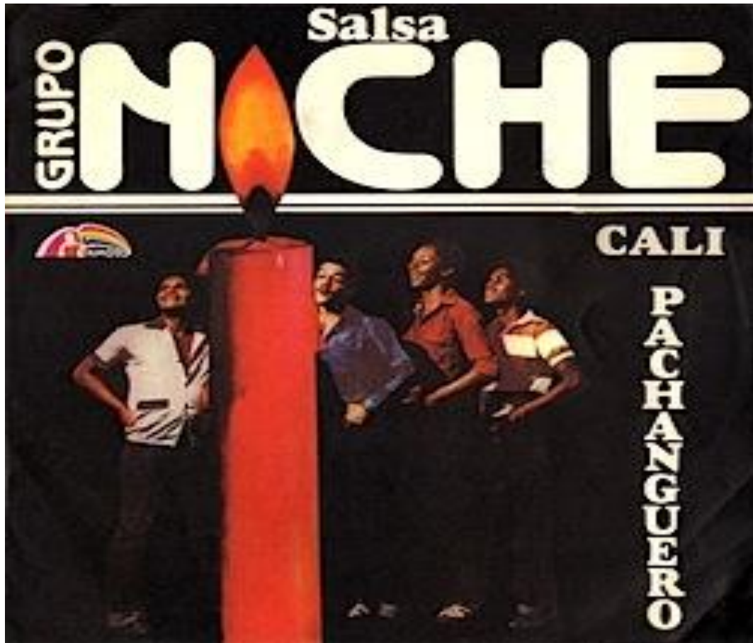
Figura 7. Grupo Niche