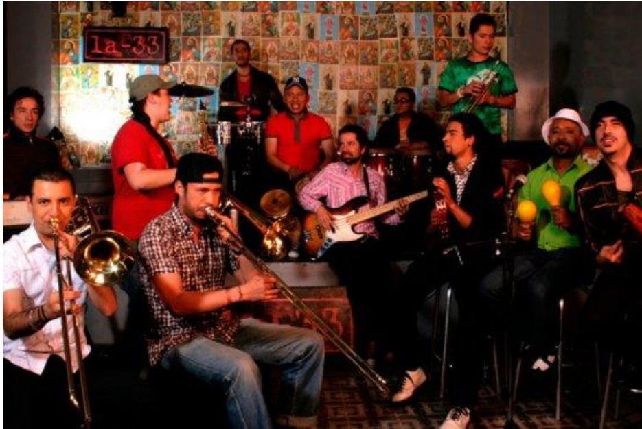
Figura 13. Orquesta La 33

Imagen 13. 49