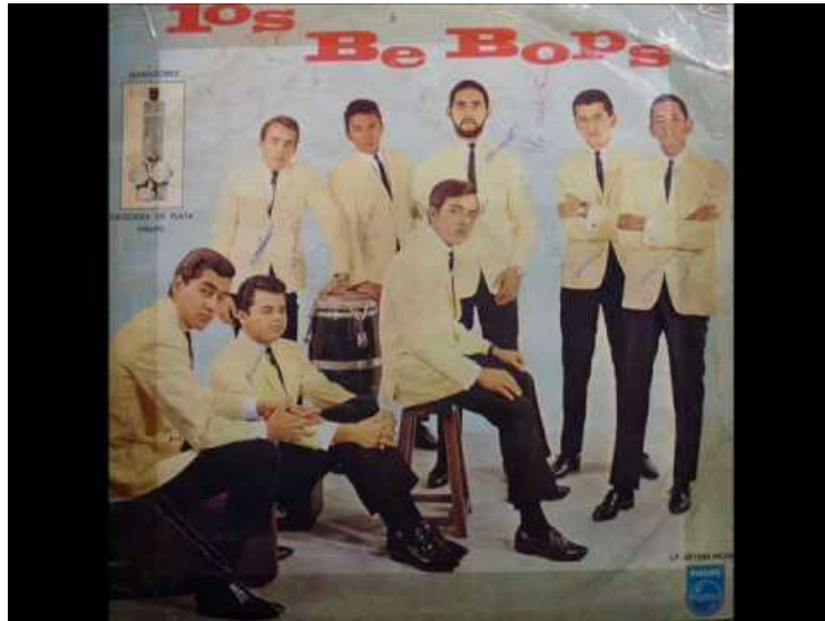
Figura 19. Los Be Bops