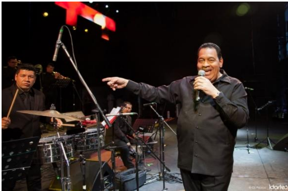
Figura 10. Tito Nieves en Salsa al Parque