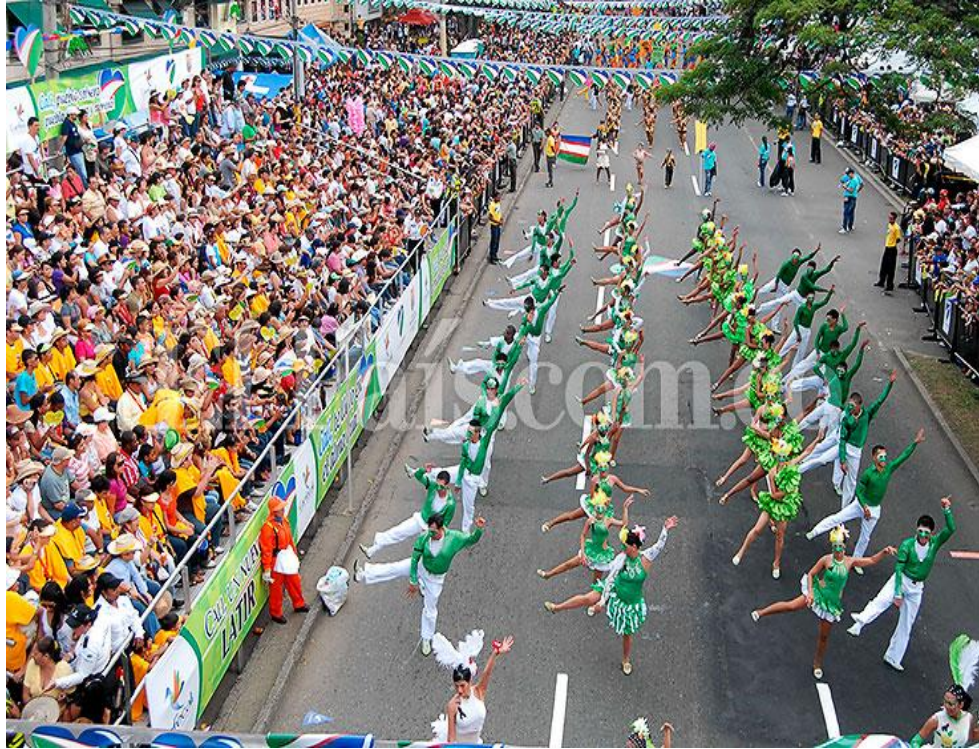
Figura 9. Feria de Cali