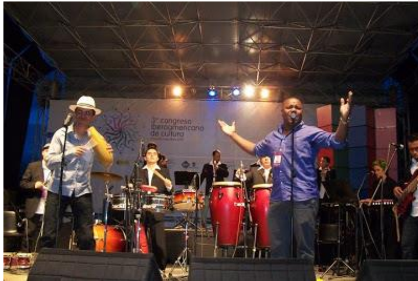
Figura 12. Orquesta La Conmoción