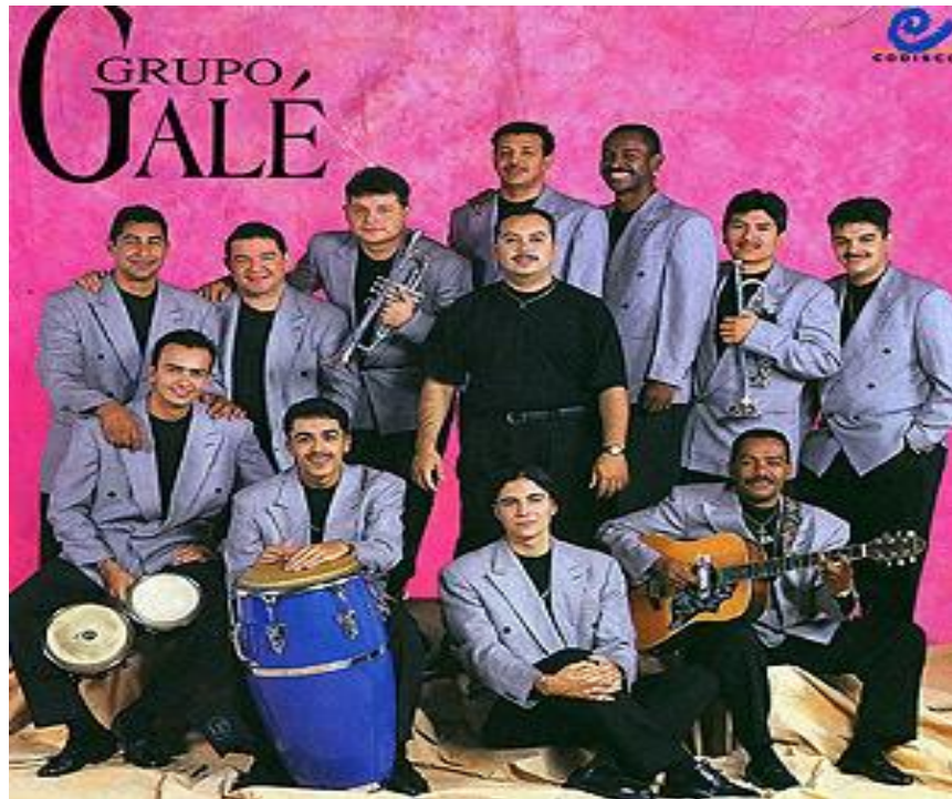
Figura 15. Grupo Galé