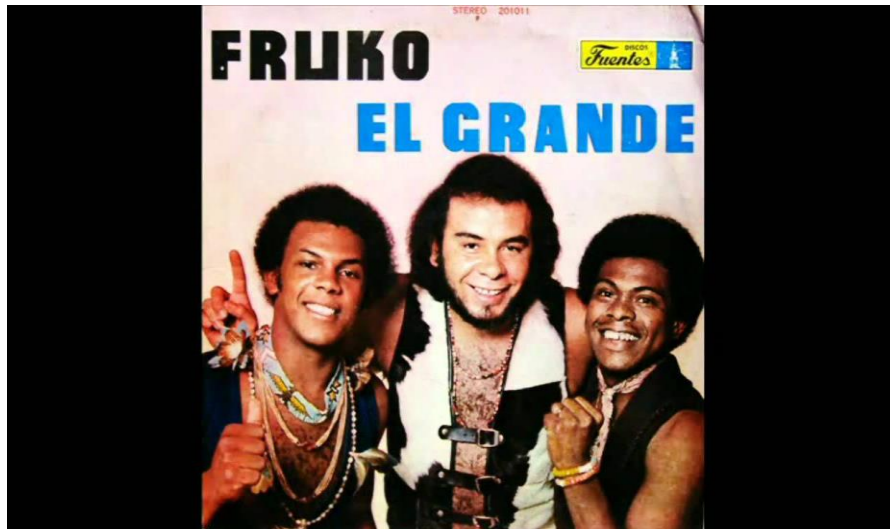
Figura 14. Fruko y sus Tesos