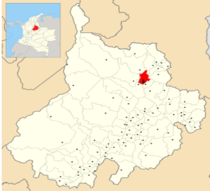
Figura 17. Ubicación geográfica de Santander, Colombia (mapa pequeño), Santander (mapa grande), Bucaramanga (sección en rojo del mapa de Santander)