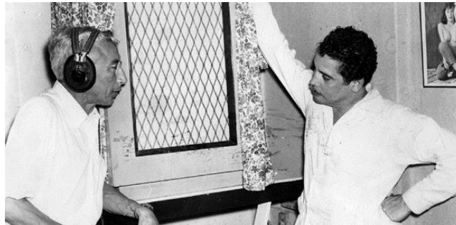
Figura 16. . El legendario Daniel Santos (derecha) también grabó con Antonio Fuentes, en la década de los 50, una de sus épocas más exitosas