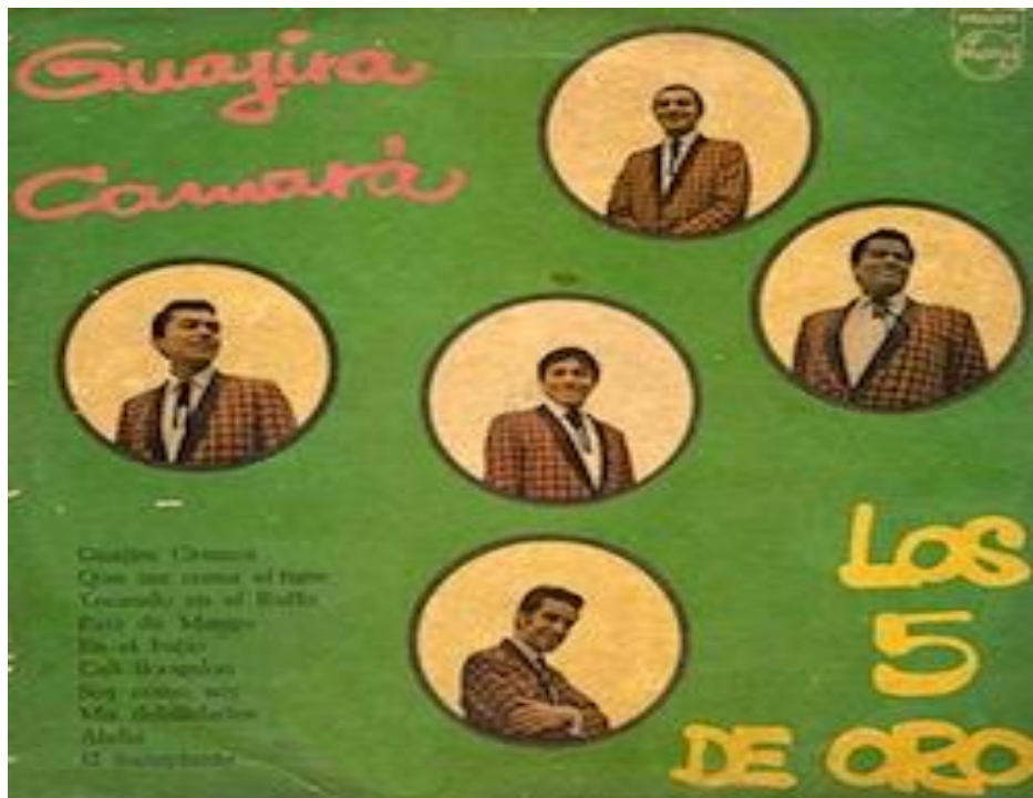
Figura 6. Carátula del disco “Guajira Camará”