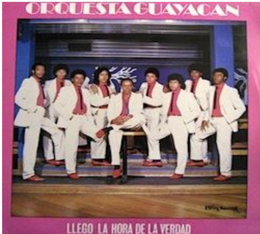
Figura 8. Carátula del primer Lp “Llego la hora de la verdad” Orquesta Guayacán