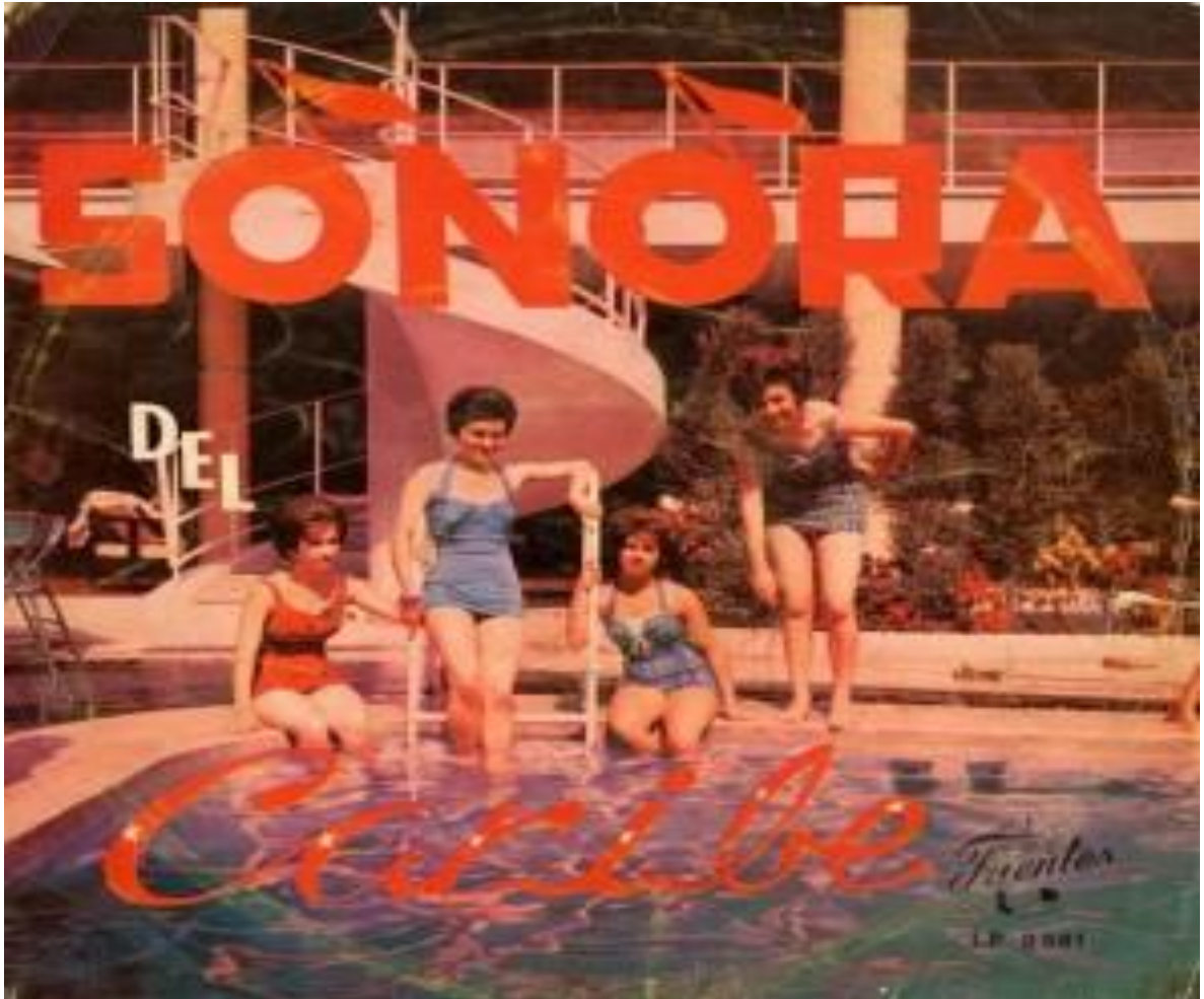
Figura 3. Sonora del Caribe, orquesta que trabajó con discos fuentes.