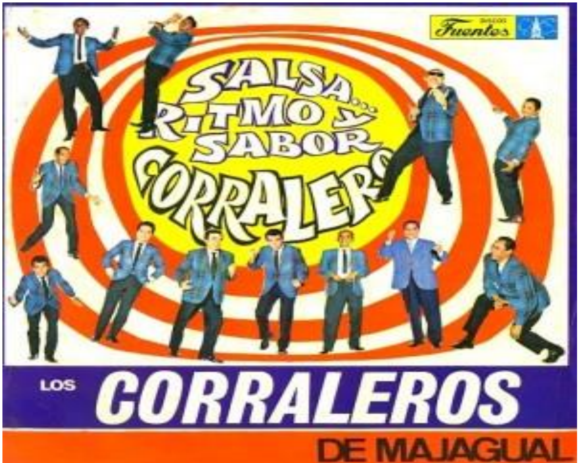
Figura 2. Lp Salsa con los Corraleros de Majagual, en los años 60's