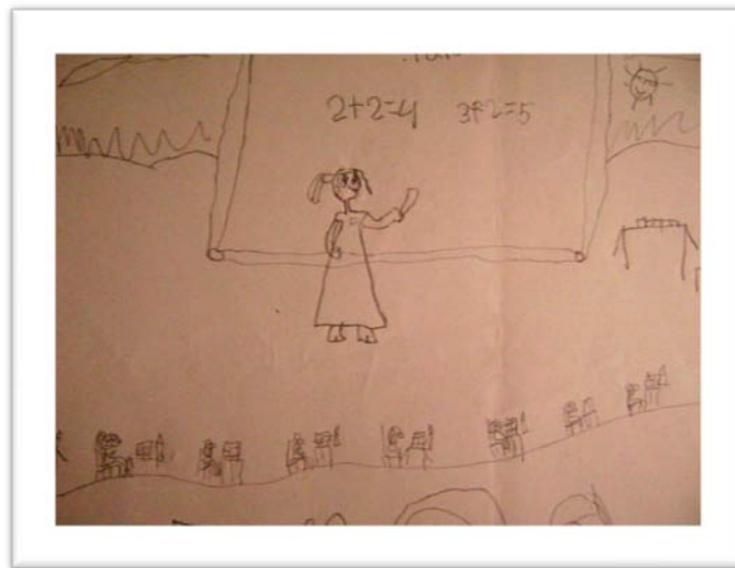
Figura 3. Dibujo de participante de primero de primaria. DB14-1PR.

Aquí el cuadro de la “enseñanza” es afín a los modelos pedagógicos tradicionales, pues se vincula al maestro con el tablero y la regla. Otro aspecto a destacar es la relación de tamaño entre el dibujo de la maestra y el de los niños sentados en pupitres, quienes a simple vista pueden parecer una “línea de hormiguitas”. Estas formas tradicionales de enseñanza también fueron recalçadas en canciones de los jóvenes de noveno, como la siguiente: