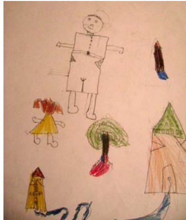
Figura 5. Dibujo de participante de tercero de primaria. DB09-3PR.

En términos generales, los relatos hablan de un trato cordial entre maestro y estudiante, pero también hablan de la importancia que prestan los estudiantes a la relación que tienen con el maestro.