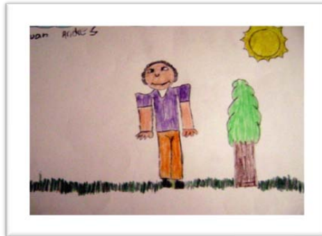
Figura 4. Dibujo de participante de tercero de primaria. DB09-3PR.

El imaginario de profesor como “persona común y corriente” rompe con la barrera tradicional entre maestro y alumno, baja al primero del “pedestal” y lo pone al nivel del estudiante, lo que para efectos de la interacción entre estos dos sujetos es un dinamizador de la relación interpersonal y de manera implícita, hace que el estudiante demande del profesor un trato igualitario, justo, horizontal y entre iguales. Así, se exige respeto, orden y disciplina tanto para el estudiante, como para el profesor y quienes no cumplen con estas condiciones mínimas para la interacción ponen barreras mediadas por la desconfianza.