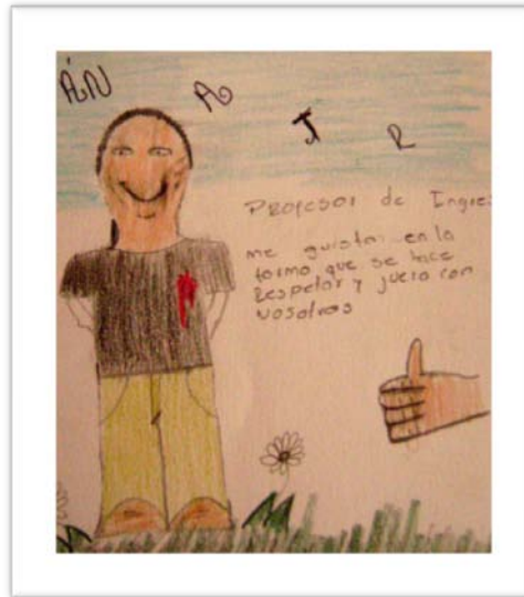
Figura 2. Dibujo de participante de quinto de primaria. DB12-5PR.

La figura 2 permite ilustrar otro aspecto señalado en esta primera categoría emergente, como lo son las características positivas (conocidas como cualidades) y las negativas (llamadas defectos). En el dibujo el actor incluye un texto que refuerza con el dibujo de una mano con el pulgar hacia arriba en signo de agrado o aceptación, el texto indica: