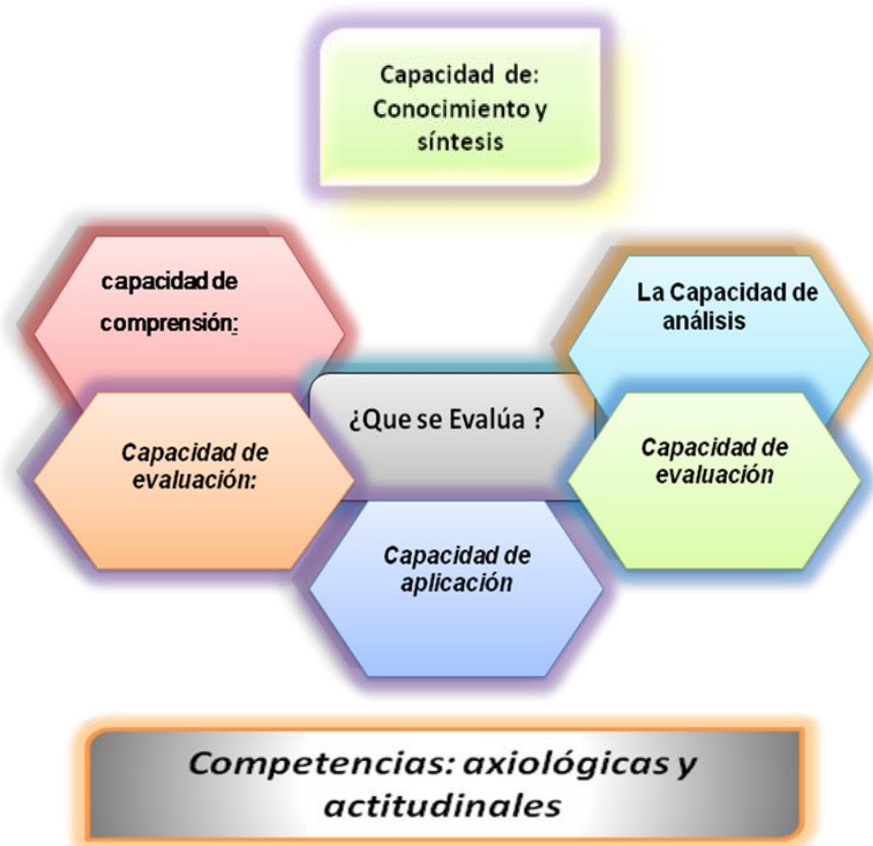
Grafica 1 ¿Qué se Evalúa?

6.1.1 Conocimientos y capacidad de comprensión se manifiestan a partir de aquellas ideas previas que posee para brindarle al estudiante la posibilidad de aproximarse a las concepciones científicas. Así mismo, es evidente tomar aquellas