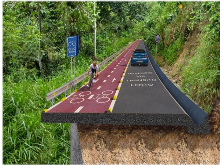
Figura 5. Proyección vía vereda Santa Bárbara.