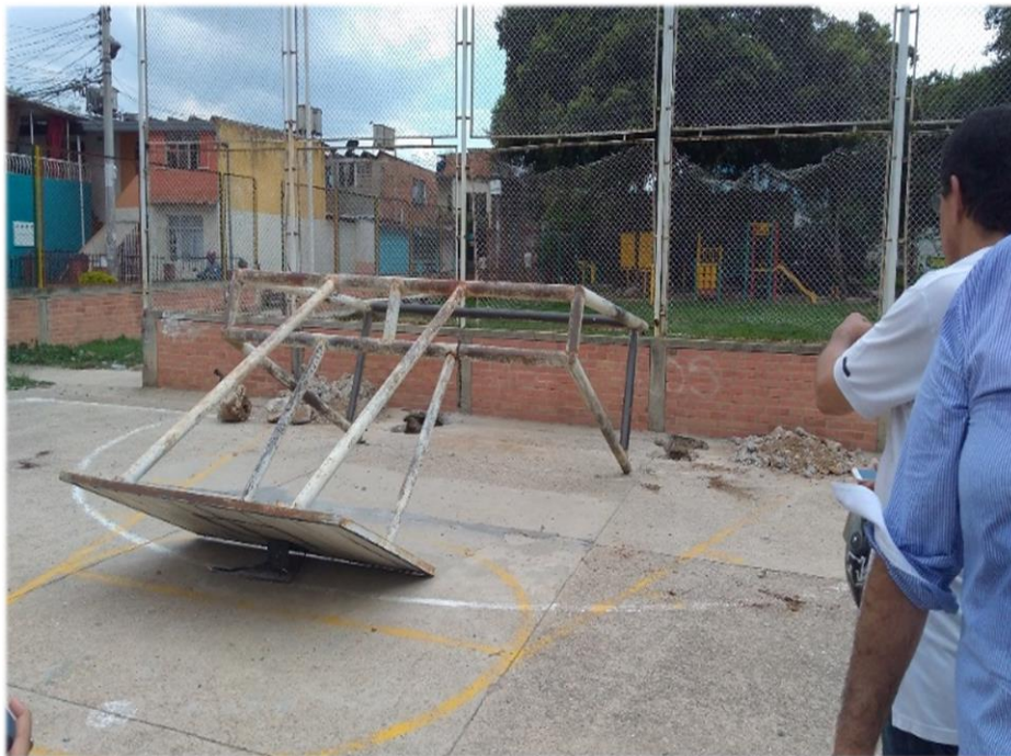
Figura 6. Centro Deportivo Rincón de Girón.

Dentro de las actividades que se plantearon para se encuentra: