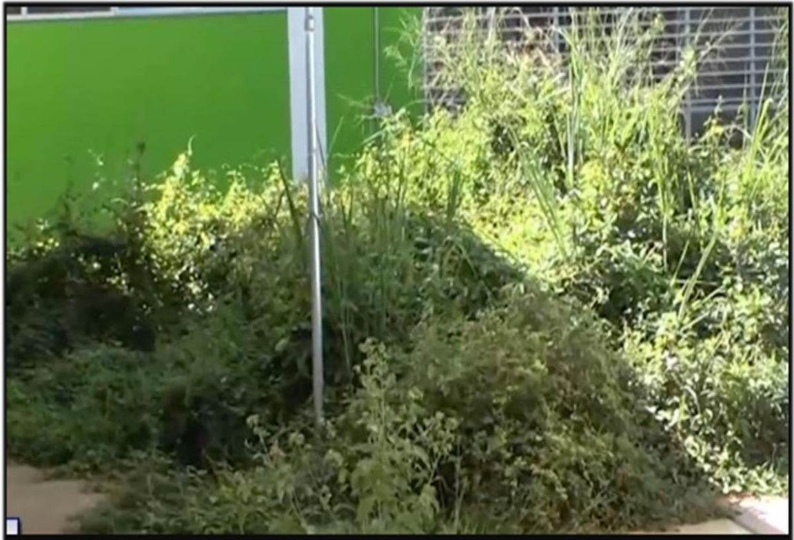
Figura 2. CDI San Gil.

3.2.2. Ciclo ruta Santa Bárbara. El proyecto ciclo ruta de la vereda de Santa Bárbara en el municipio de Bucaramanga, es un proyecto que está en proceso de