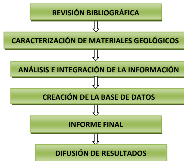
Imagen 1. Metodología propuesta para el desarrollo del proyecto.

La metodología que se llevara a cabo para la realización de este proyecto consta de las siguientes fases (Figura 1):