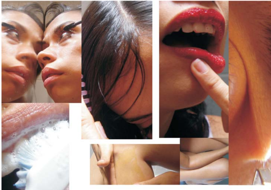
Figura 3. Fotografías seleccionadas

Fuente: La autora del proyecto. Fotografías tomadas por: Javier Vargas.