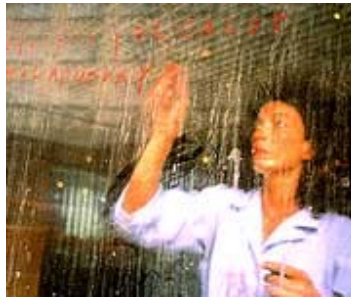
Figura 1. Vitrina.