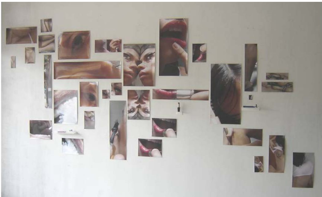
Figura 5. Montaje de la obra.

El montaje de la obra muestra las imágenes de la cotidianidad de la autora, ritualizando sus actos. (Ver Figura 5). En este se pueden apreciar algunos detalles de la obra (Ver Figura 6 y 7).