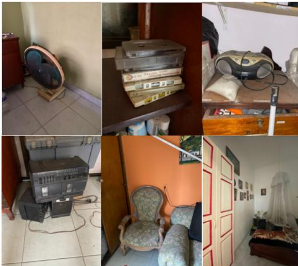
Objetos característicos de las casas de San Alonso

Nota: Objetos encontrados repetitivamente en diferentes casas del barrio San Alonso.