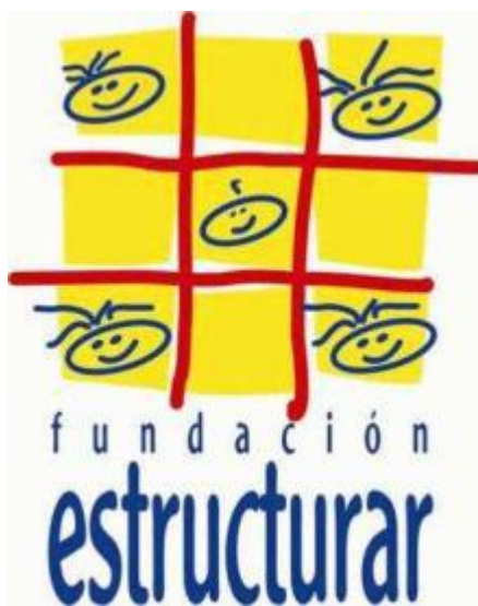
Figura 1: Fundación estructurar. 40