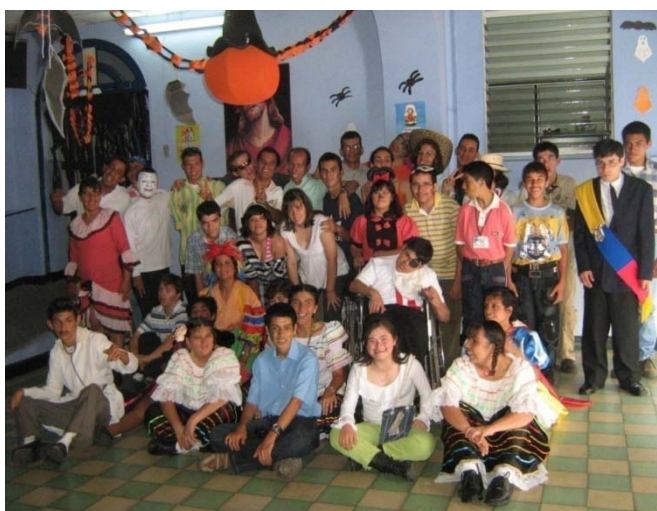
Imagen 1 Celebración de Halloween octubre de 2009.