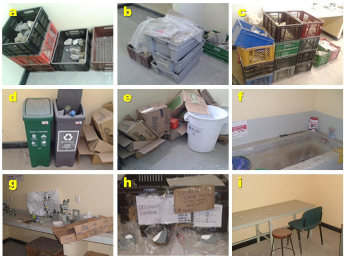
Figura 1. Aspectos generales del estado situacional de la Litoteca.