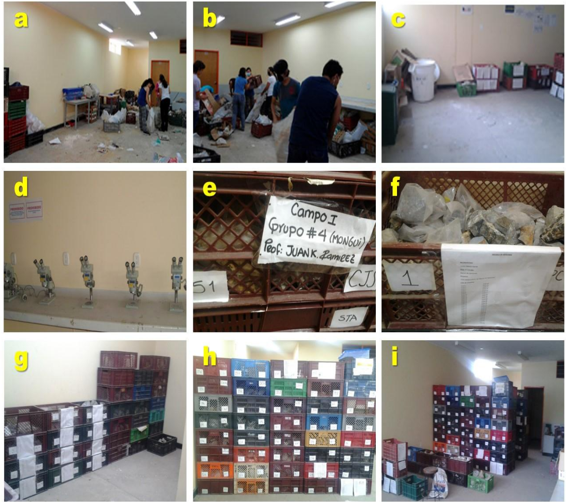
Figura 2. Aspectos generales de la intervención de la Litoteca.