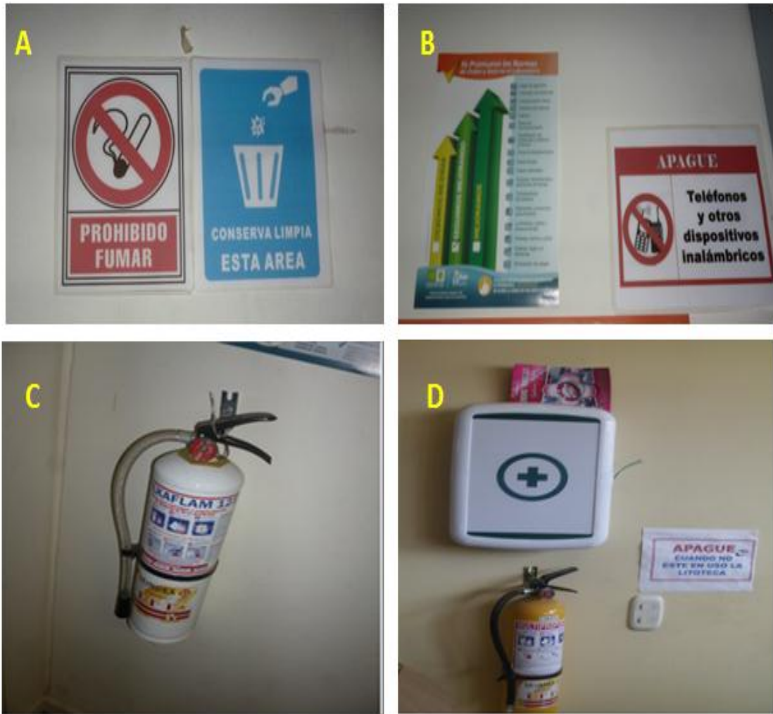
Figura 3. Adecuación general de las señales de la Litoteca.