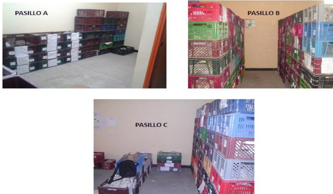
Figura 4. Diseño de la organización de pasillos.

Siguiendo un orden de ideas el montaje preciso a la hora de incluir y almacenar material a la Litoteca de la Escuela de Geología es el siguiente: