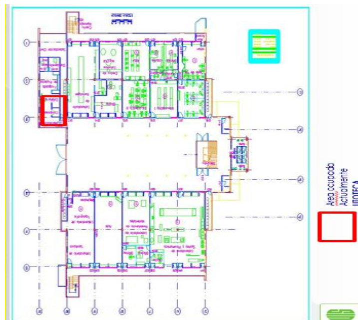
Figura 7. Ubicación de la Litoteca de la Escuela de Geología en el sótano del Edificio Álvaro Beltrán Pinzón

Figura 7 ilustra la ubicación de la Litoteca de la Escuela de Geología en el sótano del Edificio Álvaro Beltrán Pinzón, mientras la Figura 8 presenta un modelo 3D de la distribución del espacio asignado a la Litoteca y sus colecciones geológicas, área de estudio, área de reserva de materiales geológicos para la organización de colecciones geológicas de laboratorios de la Escuela de Geología, área de oficina.