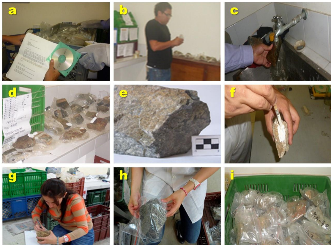
Figura 6. Actividades desarrolladas en la prueba piloto.

(11) Actualización del catálogo de la colección geológica de referencia, al cual se adicionó archivo fotográfico, diligenciamiento de formato en hoja de cálculo Excel (catálogo) y ficha técnica para su almacenamiento en una base de datos. La información geológica correspondiente a las muestras almacenadas en este catálogo de ingreso a la Litoteca (ANEXO 1), cuenta a su vez con una ficha técnica en donde se puede realizar una consulta rápida de una muestra, cuya información podrá ser almacenada en una base de datos.