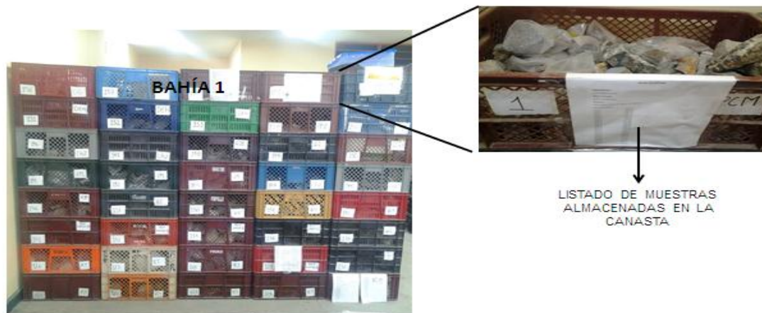
Figura 5. Diseño de la organización de pasillos, Bahías y cajas dentro del espacio destinado para la ubicación de los materiales geológicos.

Cabe resaltar que éste método de almacenamiento está sujeto a modificaciones pertinentes en el transcurso del tiempo por agentes de proliferación de material geológico, lo cual en algún momento determinado se optará por una reestructuración y un nuevo acondicionamiento de espacio.