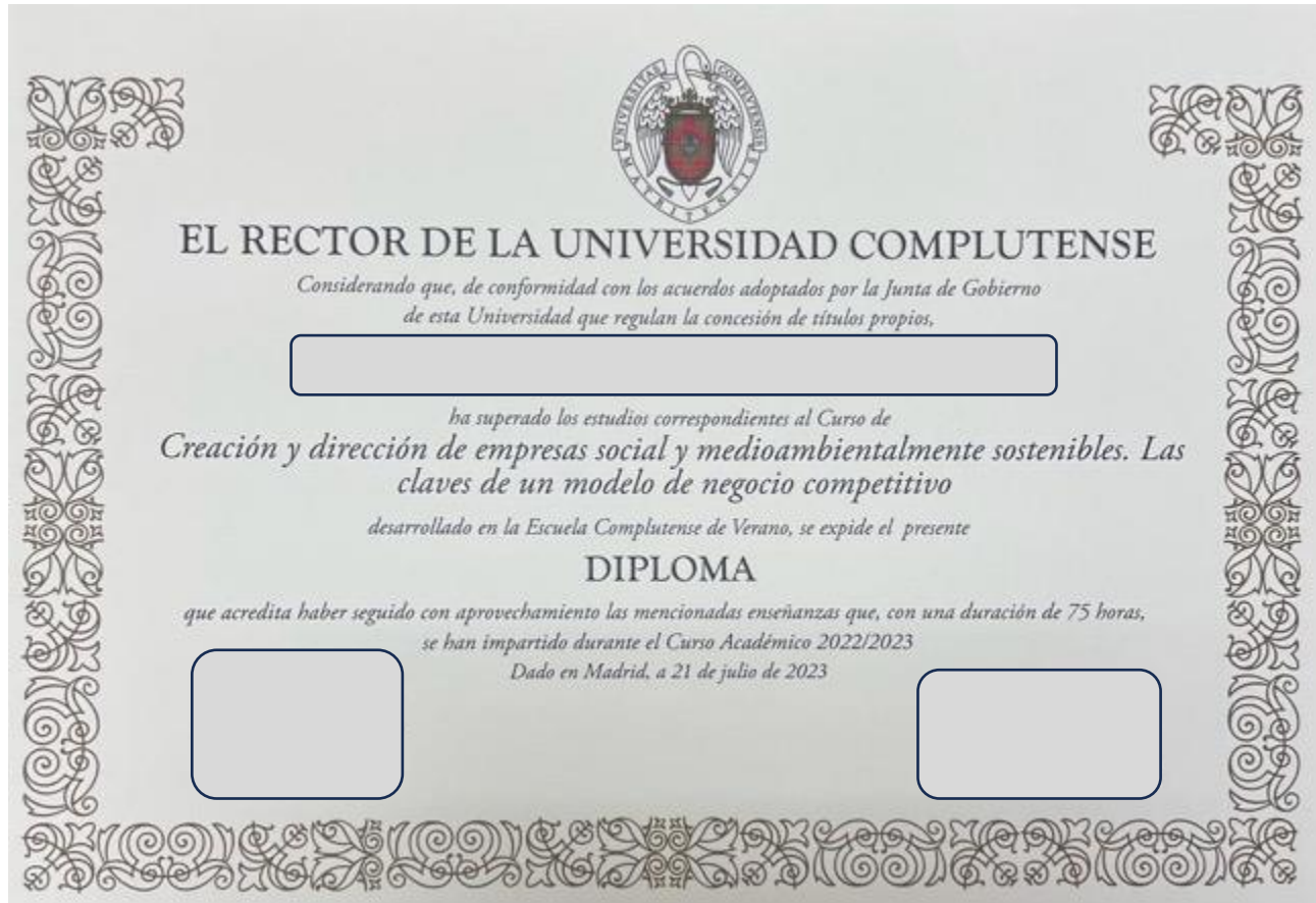
Figura 2. Certificado Universidad Complutense Madrid España 2023.

logrando realiza la instancia internacional como trabajo de grado y el curso Creación y dirección de empresas social y medioambientalmente sostenibles. La clave de un modelo de negocio competitivo (Ver Figura 2)., con el cual logre las bases para redactar el documento maestro que es un análisis reflexivo de lo cursado.