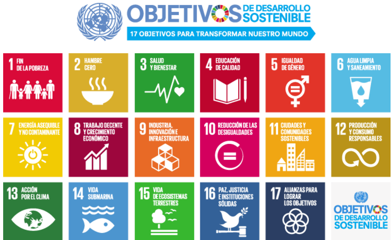
Figura 5: Objetivos de desarrollo sostenible, Naciones Unidas 2015, https://www.un.org/sustainabledevelopment/es/objetivos-de-desarrollo-sostenible/