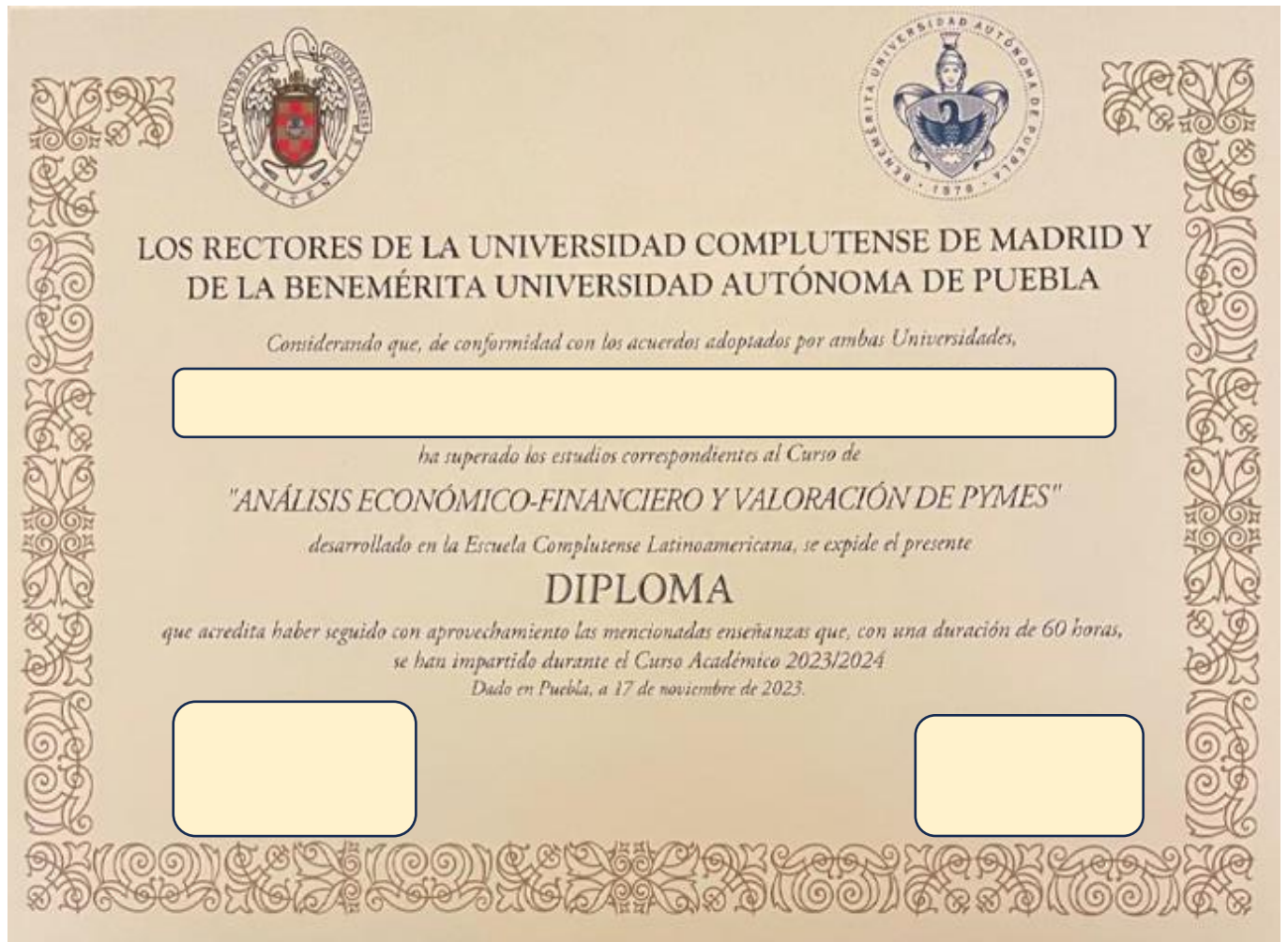
Figura 3. Certificado Universidad Benemérita Autónoma de Puebla México 2023.

Las dos movilidades fueron entregadas a la profesional de calidad académica de la Escuela de Estudio Industriales y Empresariales como soportes de cumplimiento y aporte al programa según las recomendaciones dadas por el MEN, de motivar a que los estudiantes de la maestría en motivar y tener más oportunidades de realizar estancias internacionales que enriquezcan al estudiantado y su aplicación profesional.