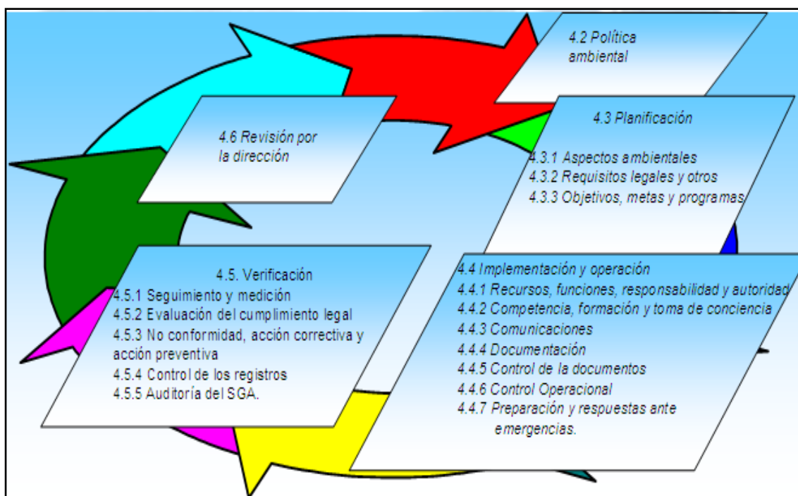
Figura12. Requisitos Norma ISO 14001

A continuación se describen los diferentes requisitos de la Norma ISO 14001 versión 2004 y se definen las recomendaciones para su cumplimiento.