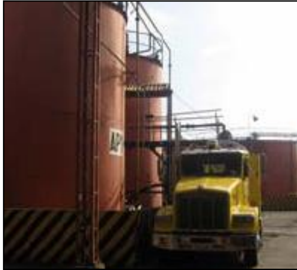
FIGURA 11. Almacenamiento de producto terminado