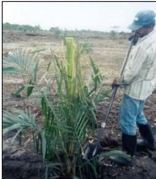
FIGURA 3. Siembra de plántulas

En esta fase se realiza el trasplante de las plántulas a los lotes definitivos, de ahí que es una labor de mucho cuidado. Generalmente se siembran 143 palmas por hectárea, lo ideal es realizar esta actividad al comienzo del periodo de lluvias.