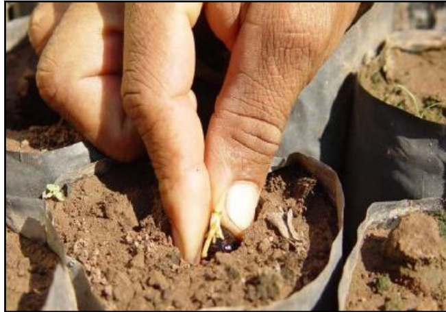
FIGURA 2. Pre-vivero