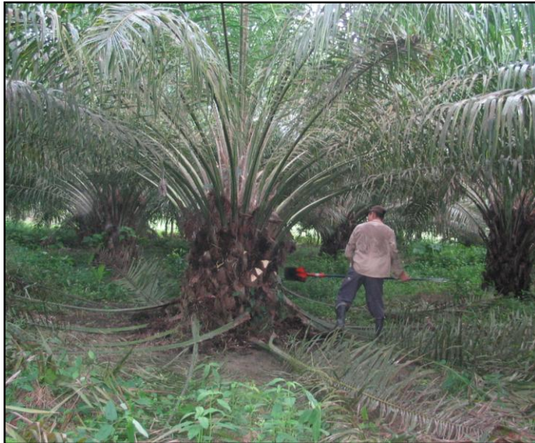
FIGURA 4. Poda de palmas

Las hojas podadas se cortan en trozos pequeños y se colocan en las entrecalles de las parcelas, con el fin de aportar materia orgánica y minerales al suelo.