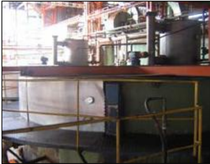
FIGURA 10. Clarificación de aceite

lograr dicha separación, se aprovecha la característica de inmiscibilidad entre el agua y el aceite.