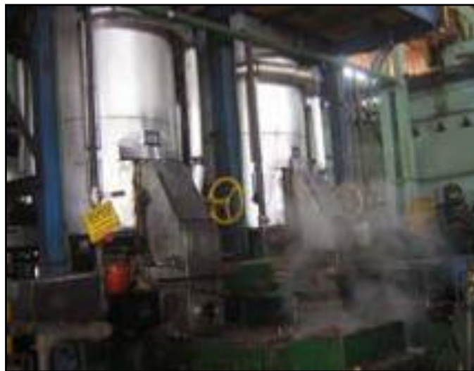
FIGURA 9. Digestión de fruto

Esta etapa se efectúa en recipientes cilíndricos verticales provistos de un eje central con brazos de agitación y maceración.