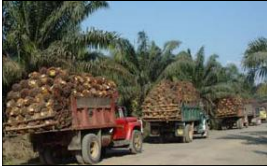
FIGURA 6. Transporte de fruto