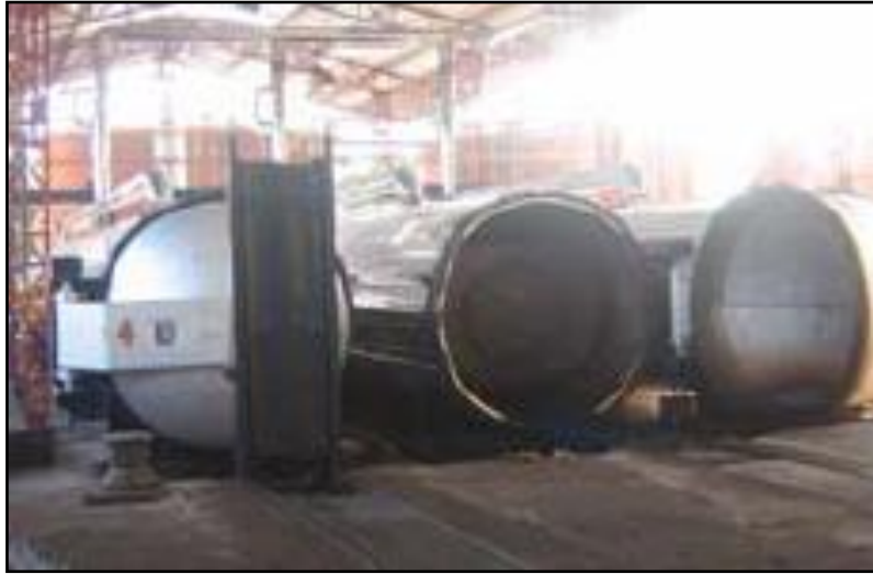
FIGURA 8. Esterilización