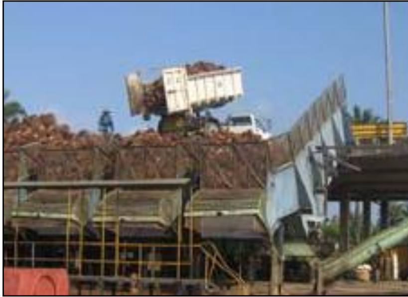
FIGURA 7. Recepción de fruto