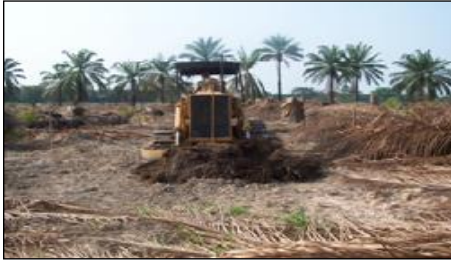
FIGURA 1. Preparación de terreno