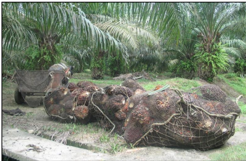
FIGURA 5. Cosecha de fruto

La cosecha se realiza a lo largo de la vida productiva de la palma de aceite y está sujeta a los criterios de madurez del fruto. Una vez los racimos están listos se cortan y caen al plato de donde son recolectados y transportados a la planta de beneficio. Para el transporté del fruto se utilizan diferentes medios como las canastillas, carretas, hasta remolques o sistemas de cable-vía.