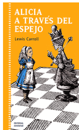
Figura 25 Portada Libro. ALICIA A TRAVÉS DEL ESPEJO

muestra su pensamiento negativo acerca de la guerra y la muerte como ese estado de perdida.