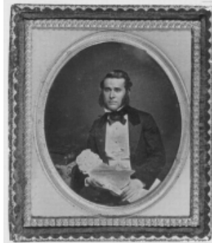
Figura 12. Fotografía Anónima. "Personaje desconocido sosteniendo niño muerto"