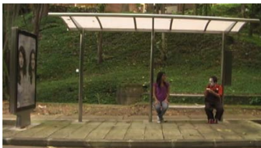
Figura 38. Locación parada

Para la grabación de la parada de bus los personajes pasaron por un proceso de maquillaje y vestuario adaptado a lo que se quiere narrar y simbolizar en la