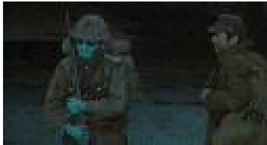
Figura 24. Imagen Segmento el túnel. Los Sueños de Akira Kurosawa