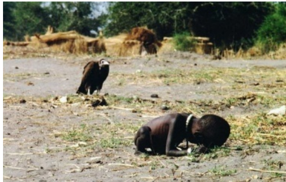
Figura 9. Fotografía de Kevin Carter. Un buitre observa a una niña que se muere de hambre (1993)