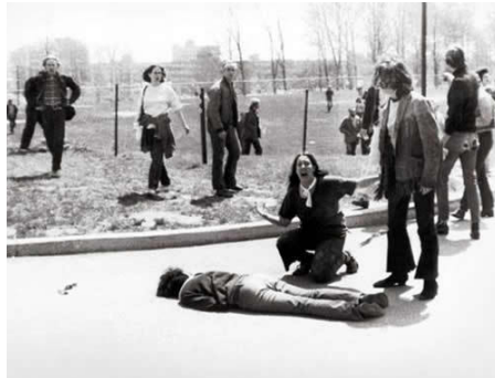
Figura 5. Fotografía de John Filo. Kent State (1970)