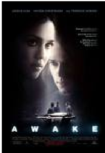
Figura 23. Imagen Publicitaria AWAKE