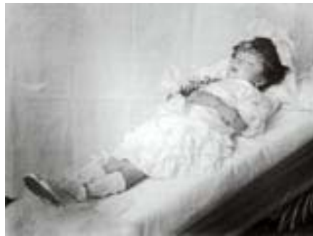
Figura 11.