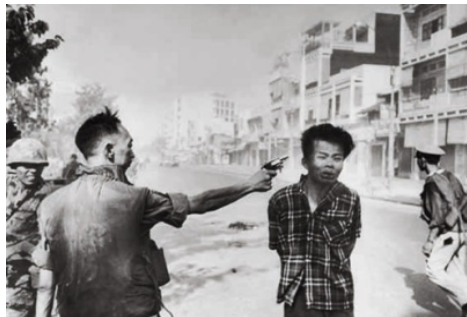
Figura 4. Fotografía de Eddie Adams. Ejecución de un miembro del Vietcong (1968)

La figura 3 muestra un monje budista vietnamita (también llamados bonzos) que se inmoló hasta morir en una calle muy transitada de Saigon el 11 de junio de 1963. Su acto de inmolación, que fue repetido por otros monjes, fue el más recordado, ya que fue atestiguado por David Halberstam. Mientras su cuerpo ardía, el monje se mantuvo completamente inmóvil. No gritó, ni siquiera hizo un ruido. Thich Quang Duc estaba protestando contra la manera en la que la administración oprimía la religión Budista en su país.