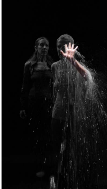
Figura 20 Imagen de Video instalación Bill Viola. 1992 The Sleepers