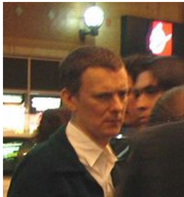
Figura 19. Imagen de MICHEL GONDRY