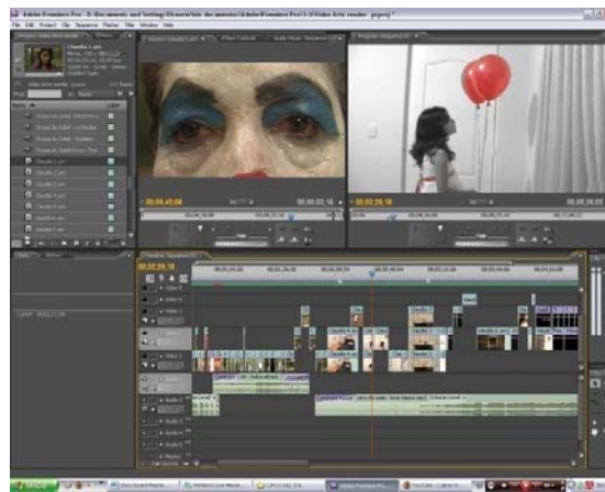
Figura 40. Imagen edición. Programa Cs3 Adobe.

video, ya que se depuraron por errores al grabar. En la escena de la parada se colocó un filtro de color azul para subir los tonos del paisaje. Para la realización de la música del video se tomó una cajita de musical, grabando su sonido a través de un micrófono, para luego pasarlo al computador.