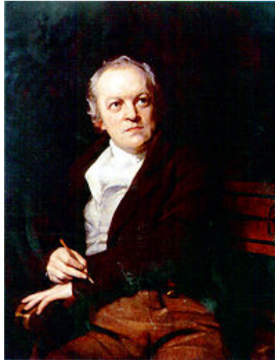
Figura 17. Retrato de 1807 por Thomas Phillips. WILLIAN BLAKE