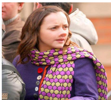
Figura 22 Imagen Publicitaria PENELOPE