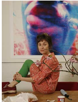
21 Figura. Imagen Pipilotti Rist. Homo sapiens sapiens