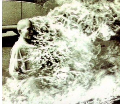
Figura 3. Fotografía de Malcolm Browne. Monje Thich Quang Duc

Fuente: http://www.saladeprensa.org/art763.htm