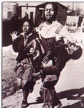
Figura 6. Fotografía de Sam Nzima Levantamiento de Soweto (1976)

Fuente: http://sonandolarevolucion.wordpress.com/category/11-s/