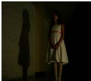
Figura 39. Locaciones pasillo (grabación)