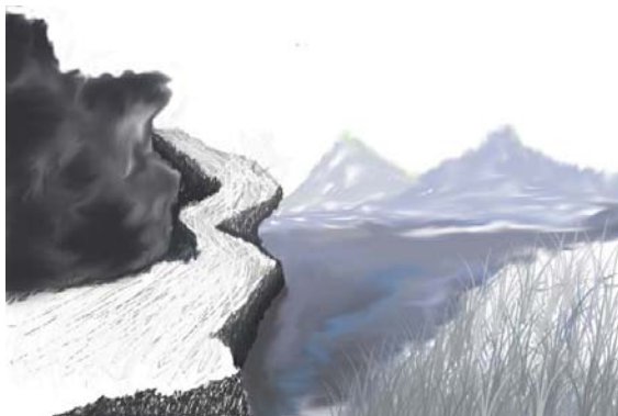
Figura 26. Claudia Sanabria. Pintura en Photoshop. 2006

Luego se llegó a realizar un ejercicio en fotografía, desarrollando una "fotonovela" (figura 27) con un trabajo de campo que duró tres días, utilizando diferentes