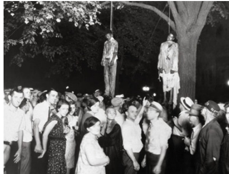
Figura 1 Anónimo. Linchamiento de dos jóvenes negros (1930)