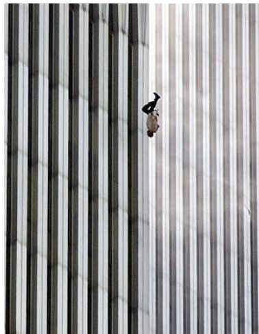
Figura 10. Fotografía de Richard Drew . Hombre Cayendo (2001)

Fuente: http://www.saladeprensa.org/art763.htm