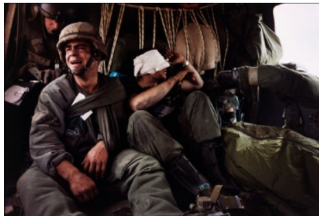
Figura 8. Anónimo. Bajas de la guerra (1991)

Fuente: http://sonandolarevolucion.wordpress.com/category/11-s/