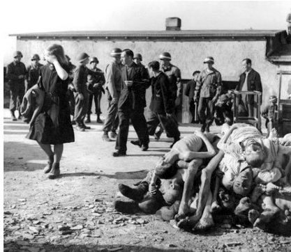
Figura 2. Anónimo. Buchenwald (1945)