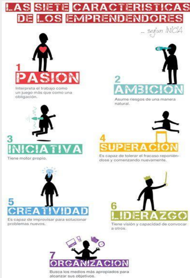
Gráfico: “Características de un emprendedor”