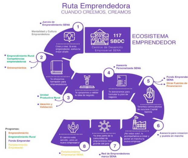
Fig. 3 Ruta Emprendedora SENA SBDC

El SENA a través de la ruta emprendedora contribuye con los objetivos trazados en esta monografía, donde los emprendedores sin importar si pertenecen o no al SENA, pueden acceder a ella y apalancar sus proyectos de vida, sus emprendimientos y el crecimiento y el fortalecimiento de los que ya se encuentran en marcha.