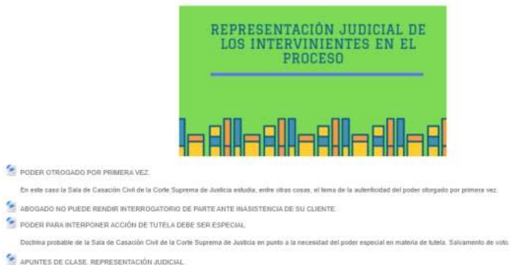
Figura 8 Curso Derecho Procesal Civil I: Representación Judicial