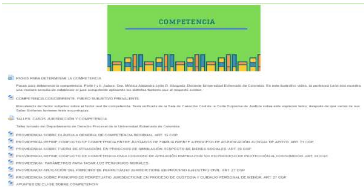
Figura 9 Curso Derecho Procesal Civil I: Representación Judicial

En la presente unidad, se trabajaron los diferentes factores determinantes de la competencia, abordamos como determinar la cuantía, factores subjetivos, objetivos entre otros factores determinantes de la competencia, se subió al aula virtual los apuntes de clase pertinentes a la unidad temática (Anexo 10) y de igual forma se llevaron algunos impresos para facilitar la comprensión de la temática en las clases presenciales en los salones de clase