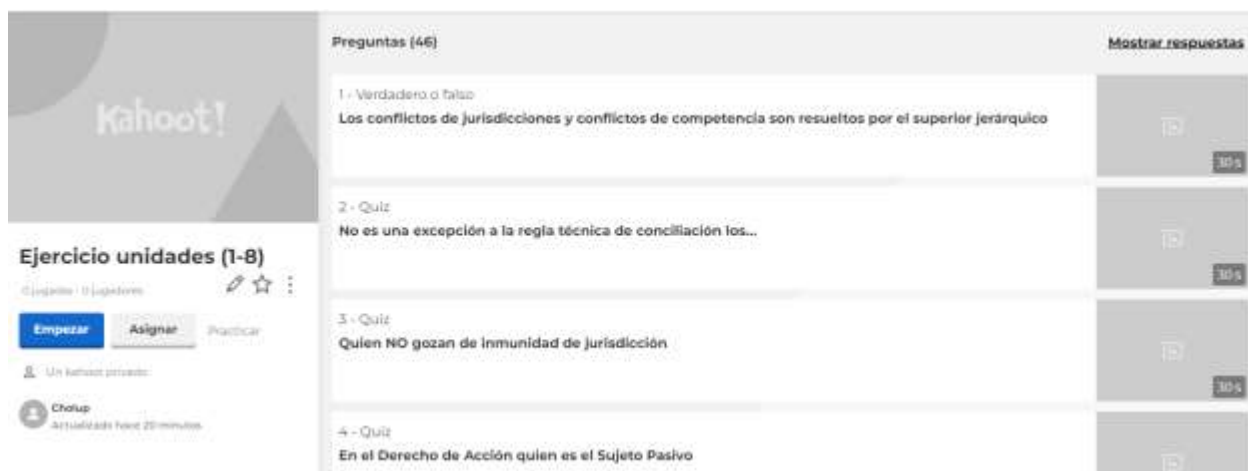
Figura 11 Unidad Temática (1-8): kahoot