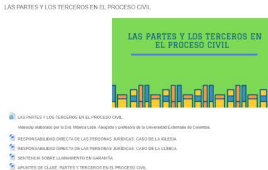
Figura 7 Curso Derecho Procesal Civil I: Las Partes y los Terceros

En la presente unidad, se trabajó el concepto de partes y quienes intervienen dentro de un proceso civil. Se manejó el mismo esquema a las unidades anteriores dejando en el Moodle los apuntes de clase sobre las partes y los terceros en materia civil (Anexo 8) y se complementaron las lecciones en las aulas de clase de manera presencial, clase impartida por el docente catedra y acompañada del estudiante practicante.