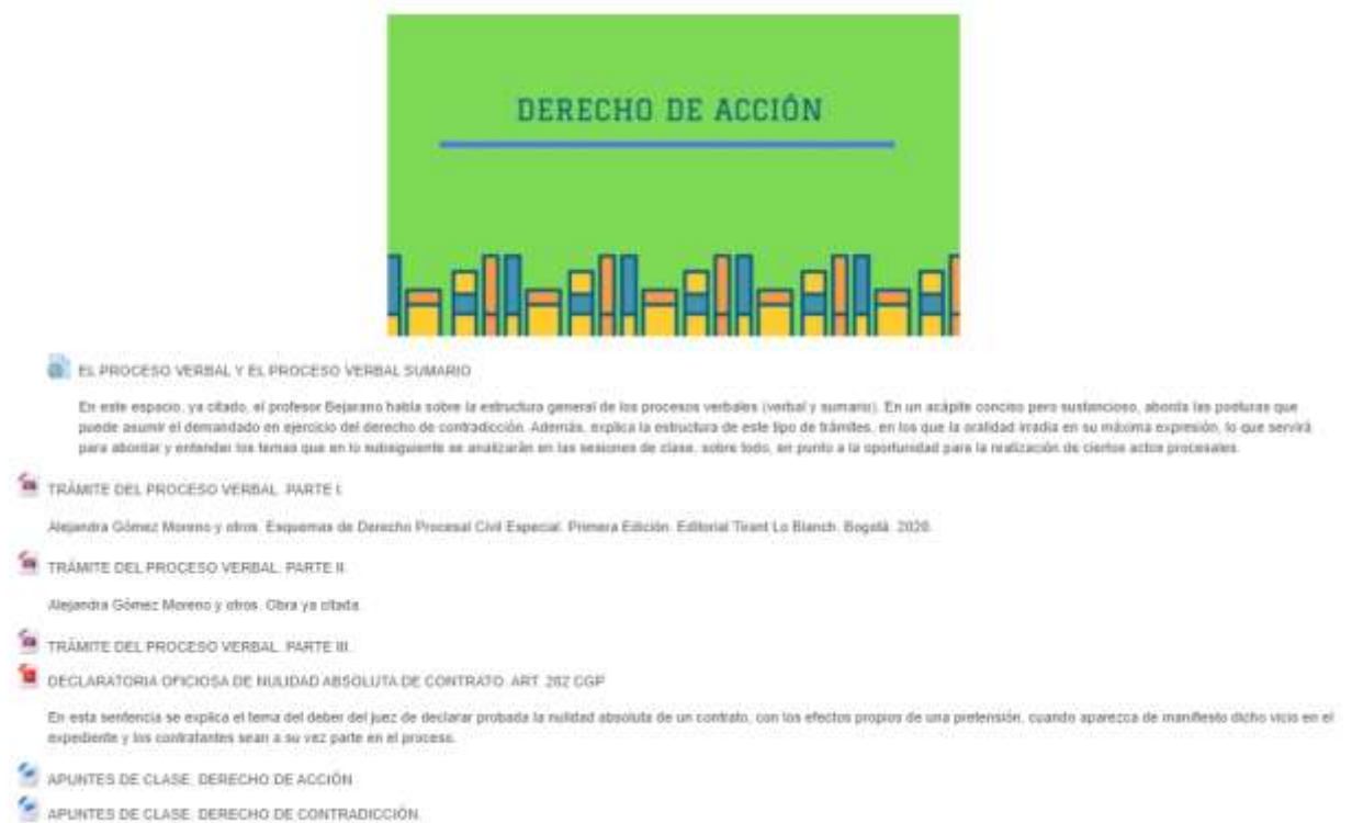
Figura 5 Curso Derecho Procesal Civil I: Derecho de acción y contradicción Extraído de: https://fic.uis.edu.co/ava/course/view.php?id=38357