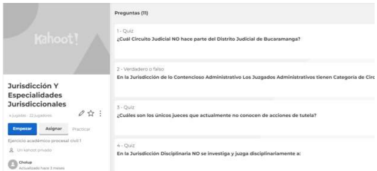
Figura 3 Unidad Temática 1: kahoot

Se planteó la realización de una competencia mediante la aplicación Kahoot el cual estaba compuesto por (11) preguntas de selección múltiple y falso y verdadero en donde los mejores puntajes recibirían un incentivo en la calificación del primer parcial de la asignatura. Las preguntas fueron elaboradas con la información brindada por el docente en los salones de clase y los apuntes de clase encontrados en la plataforma Moodle.