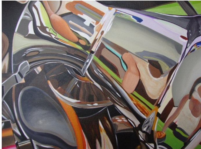
Figura 5 Lucy castro. “sin título” Boceto 1, 2010. Acrílico sobre lona, 30x25 cm.

El primer boceto de la segunda etapa del proceso fue importante, es en este momento donde se toma la decisión de trabajar el autorretrato a partir de los reflejos, idea la cual fue de común acuerdo con el asesor de proyecto, sin embargo los resultados no son los esperados pues se evidencian demasiado la participación del metal y menos de la figura humana, puesto que la superficie de los objetos eran lisas en mayor parte y la imagen reflejada no proporcionaba los resultados esperado, de modo que se toman decisiones aún mas importantes como por ejemplo la utilización de objetos metálicos que tuvieran superficies curvas que deformaran fuertemente la imagen, y se trabajaría a partir de la fragmentación para mostrar solo algunas partes del cuerpo. Por consiguiente se hizo una taxonomía para seleccionar los objetos metálicos que cumplieran con las características deseadas.