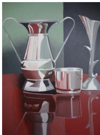
Figura 2. Lucy Castro. “Bodegón 2” Boceto 2009, acrílico sobre lona 60x50 cm.

En ella se puede ver un fondo más neutro que en el primer boceto, pero sin ningún resultado importante a favor de lo que se quería, así que lo que procede en los siguientes bocetos es a eliminar por completo el fondo lleno de colores que no habían dado ningún buen resultado y se procede a dejarlo de un solo color y la mesa completamente blanca y eliminando toda clase de reflejos que no estuvieran directamente en los objetos metálicos, luego se tomaron algunas fotos con las anteriores características para luego hacer los bocetos tanto a lápiz como en pintura. (Ver figura 3, Y 4,).