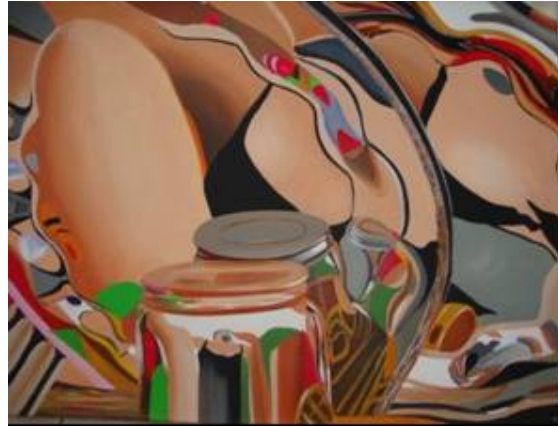
Figura 13 Lucy castro. “sin título” Boceto 9 2010 acrílico sobre lona, 30x25 cm.