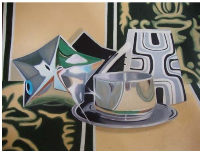
Figura 1. Lucy Castro. “Bodegón 1” Boceto 2009. Acrílico sobre lona, 40x30 cm

A partir de este momento el proceso inicia haciendo dibujos y pinturas de los objetos metálicos tales como jarras, bandeja y vasos, en ese tiempo lo único que importaba era tratar de pintarlos lo más parecido posibles tal como los veía en los registros fotográficos sin tener en cuenta hasta este instante el tema que se llevaría a cabo, por lo cual se presentaron como bodegones, (ver figura 1).