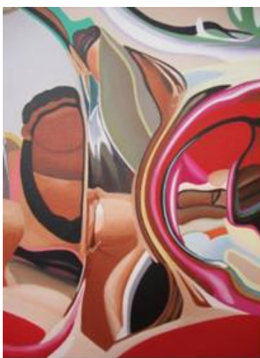
Figura 6 Lucy castro. “sin título” Boceto 2, 2010 acrílico sobre lona, 30x25 cm.

Luego se hizo un segundo boceto (Ver figuras 6), el cual tampoco dio los resultados esperados pues los colores no eran de agrado personal porque estaban al azar y no por decisión propia, y es a partir de este momento que se empiezan a seleccionar los colores a utilizar, ya elegidos estos colores y teniendo en cuenta las anteriores características se logró un mejor resultado en cuanto a lo que buscaba en el análisis del color y demás elementos, (Ver figura 7). Por lo cual el paso a seguir fue tomar muchas fotografías en donde el cuerpo fue el eje central, reflejando las partes del cuerpo que más me gustan, buscando los ángulos que más apropiados fueran para proporcionar el resultado esperado y que además mostraran fragmentación, haciendo notar por medio de ella la ausencia de partes del cuerpo como símbolo del autorrechazo al cuerpo real, pero recreados en su reflejo a través de los colores símbolo de sus sentimientos.