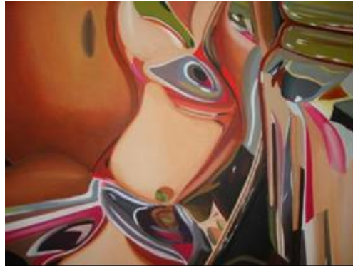
Figura 10 Lucy castro. “sin título” Boceto 6 2010 acrílico sobre lona, 30x25 cm.