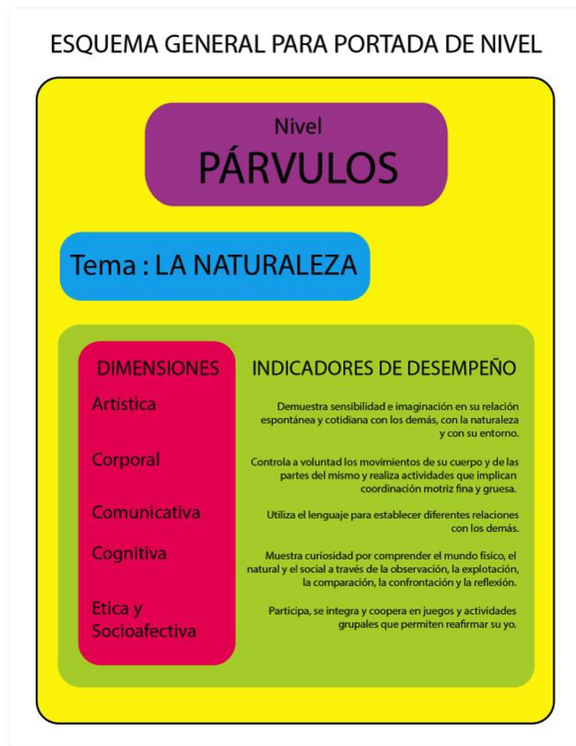
Figura 8. Esquema general para portada de nivel

La información general por cada nivel está relacionada en una portada presente al inicio de cada módulo, en la cual figuran: El nivel, el tema a tratar en todo el módulo y una descripción detallada de los indicadores de desempeños propuestos en base a las dimensiones de desarrollo.