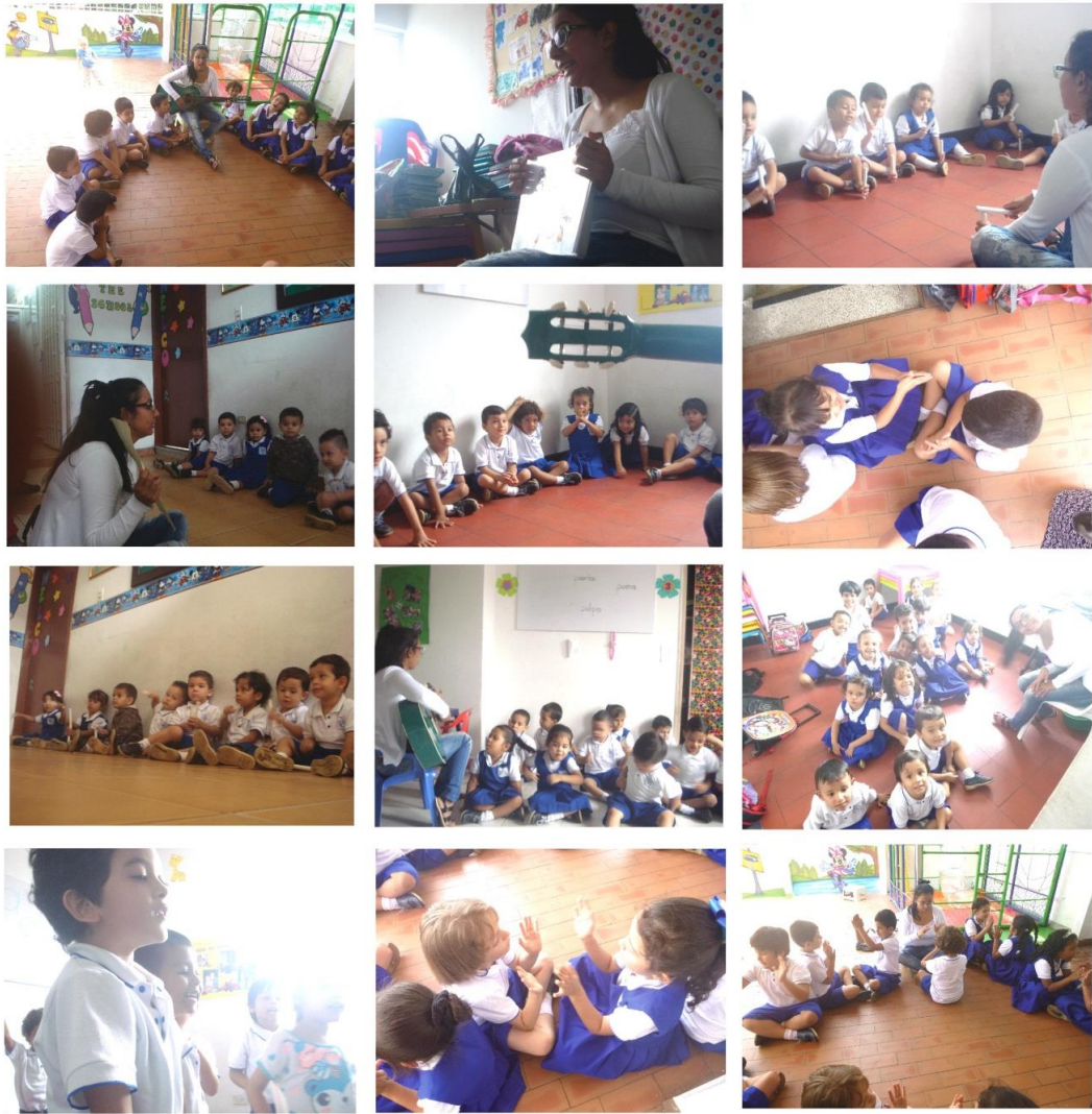
Figura 1. Registro fotográfico sesión de grupo con diferentes grados de preescolar.